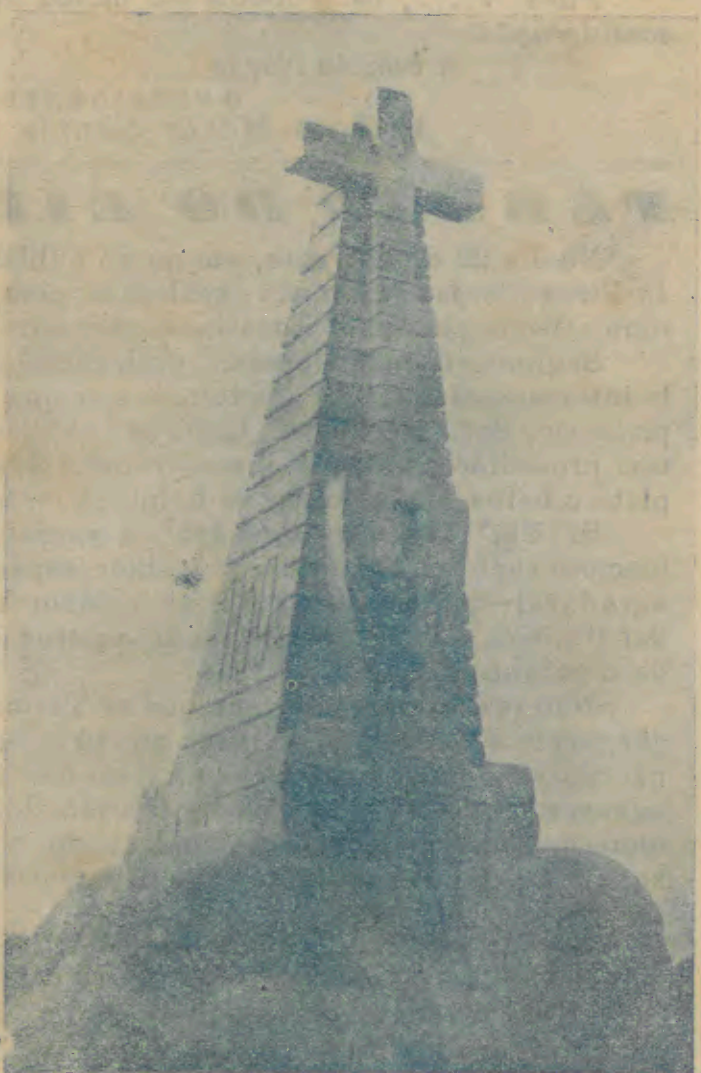
Cruzeiro Monumento dos Centenários do concelho de Barcelos, erecto na historica Citania de Roriz