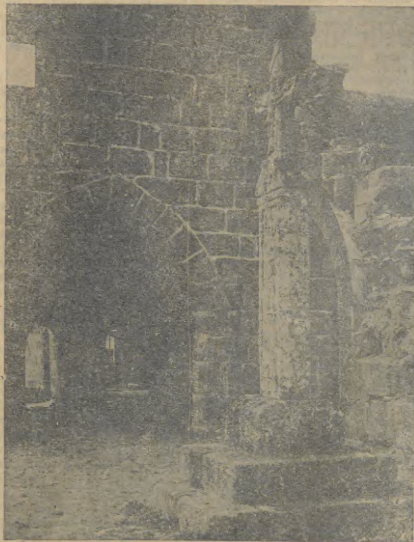
BARCELOS—Lindo aspecto duma dependencia das Ruínas dos Paços dos Condes Duques de Bragança (Sec. XV), vendo-se tambem, o Senhor da Cruz do Galo (peça arqueologica que pertenceu á força). No recinto do Paço, está a proceder-se a diversas obras, que muito o embelezará

Que S. Ex.ª continue de boa saúde e a fazer anos, muitos anos, são os votos de todos os que labutam nesta Trincheira.