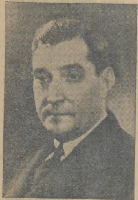
Dr. Antonio Oliveira Salazar

Segunda-feira, depois do Ex.ºmº Chefe do Governo, Snr. Doutor Oliveira Salazar, ter lido um patriótico e assombroso discurso sobre a ratificação do Pacto do Atlantico, cujo discurso