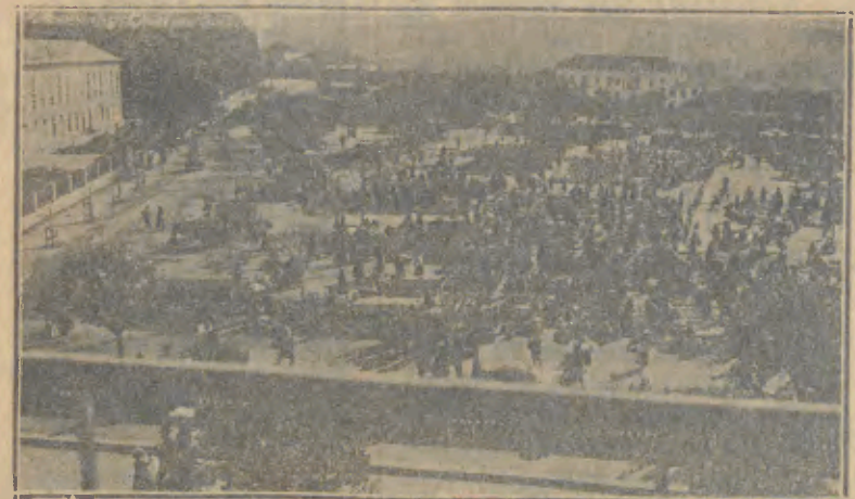
BARCELOS—Magestoso Campo da Feira—o maior de Portugal—onde, nos dias 1, 2 e 3 de Maio, se realizarão as tradicionais e importantissimas Feiras das Cruzes, as mais típicas, as mais concorridas e as de maior atracção do Minho.