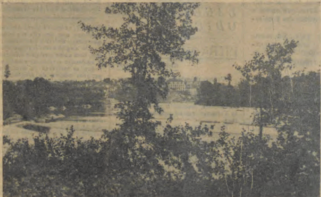
BARCELOS—Interessante aspecto do Rio Cávado, onde, no dia 3 de Maio—FESTAS DAS CRUZES—haverá o maior, o mais imponente FESTIVAL que se tem levado a efeito neste poetico Rio. Fogos aquáticos e fogos do ar—Mais de 20.000 lumes vivos—Serenata—Barcos iluminados a capricho—Musicas, etc., etc.