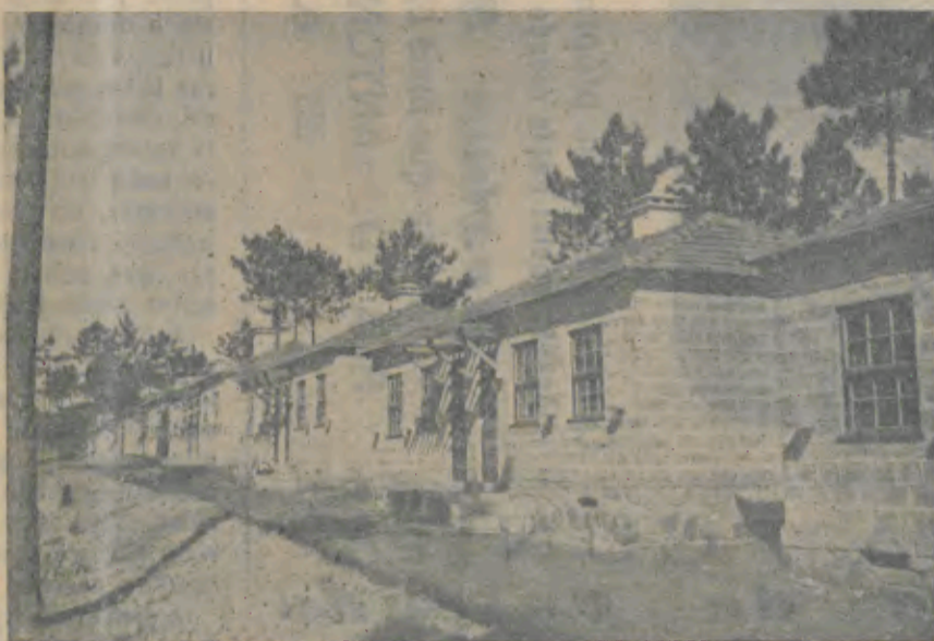
Outro aspecto do Bairro Económico

Há pouco tempo ainda os jornais anunciaram o resgate do Porto da Beira, um dos mais importantes da África,