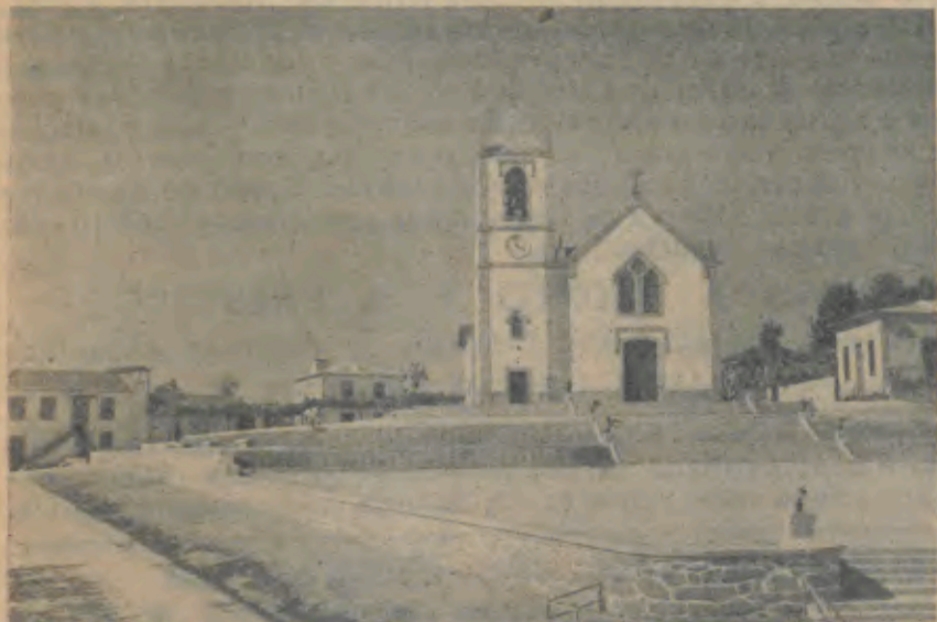
BARCELOS—Alongamento do adro da Igreja de Macieira e Escadório

de dar o governo do Estado Novo que encheu os homens cren-tes, do destino sublime da Pátria, de orgulho e fé na grandeza imorredora que se estenderá pelos séculos fora. A nossa convicção do momento deve ser a de que o governo não dorme sobre os louros alcançados nestes últimos anos de intensa preocupação administrativa e de muitas contrariedades