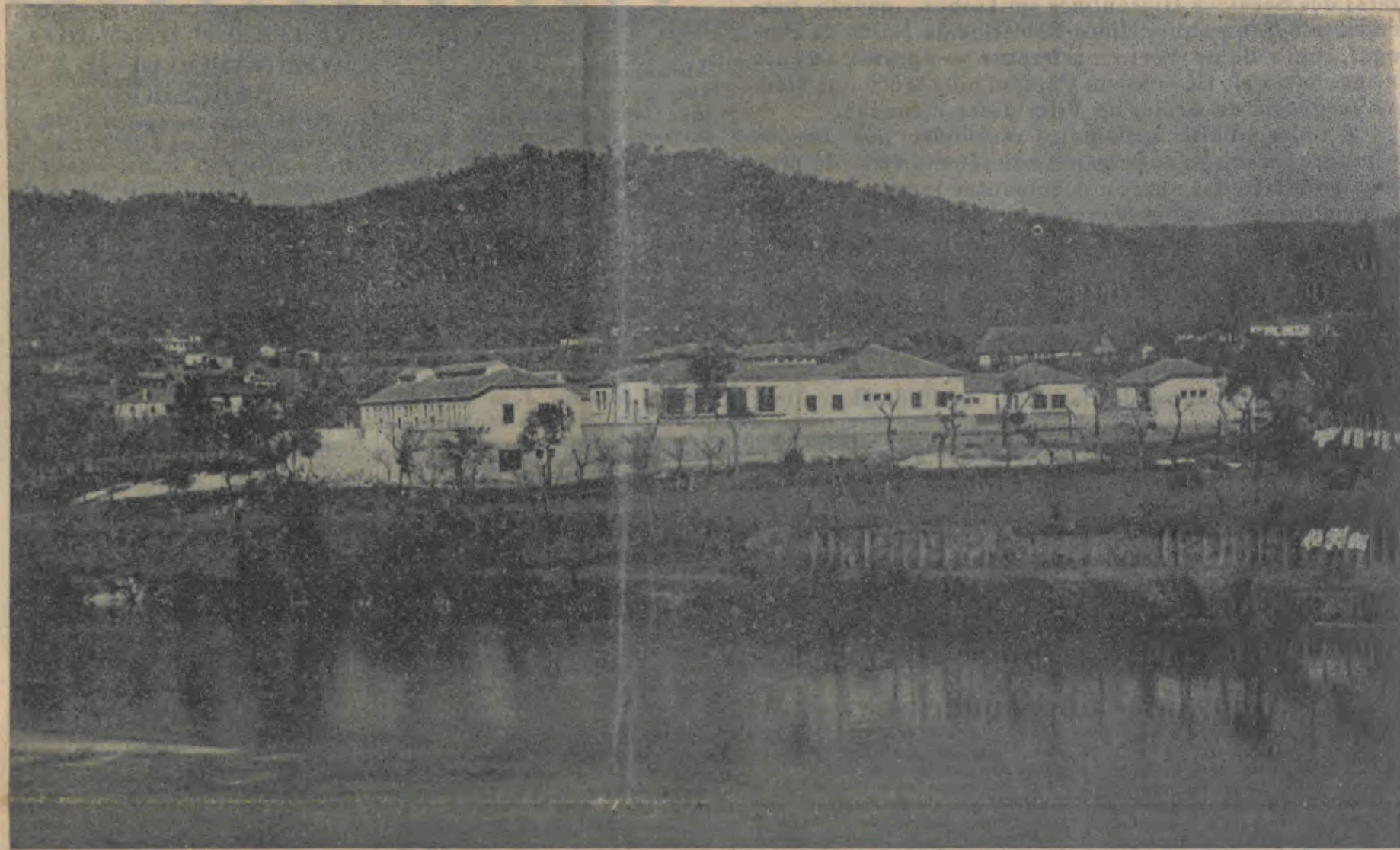
OS MAGESTOSOS EDIFICIOS DO MATADOURO REGIONAL DE BARCELOS