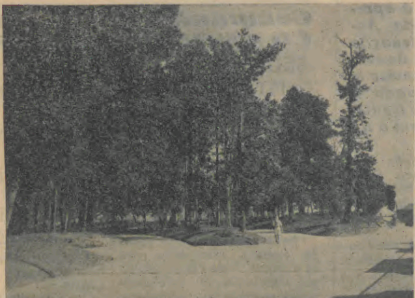
Outro aspecto do Parque da Cidade

de dar o governo do Estado Novo que encheu os homens cren-tes, do destino sublime da Pátria, de orgulho e fé na grandeza imorredora que se estenderá pelos séculos fora. A nossa convicção do momento deve ser a de que o governo não dorme sobre os louros alcançados nestes últimos anos de intensa preocupação administrativa e de muitas contrariedades