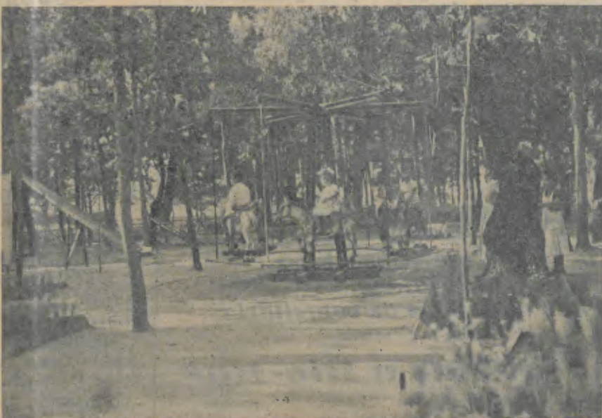
O Parque Infantil, onde as crianças se divertem