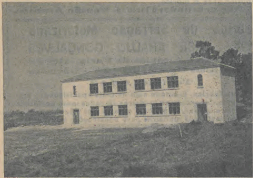
BARCELOS—Escola de Frogo (estão mais 9 em construção)

O Governo soube mais uma vez por em evidência o grande mobil que o anima em resgatar a soberania do Império, e concorrer para o seu grande e insuspeito prestígio no mundo dos cobiçosos. Mais uma lição aos portugueses cépticos acaba de dar o governo do Estado Novo que encheu os homens cren-tes, do destino sublime da Pátria, de orgulho e fé na grandeza imorredora que se estenderá pelos séculos fora. A nossa convicção do momento deve ser a de que o governo não dorme sobre os louros alcançados nestes últimos anos de intensa preocupação administrativa e de muitas contrariedades