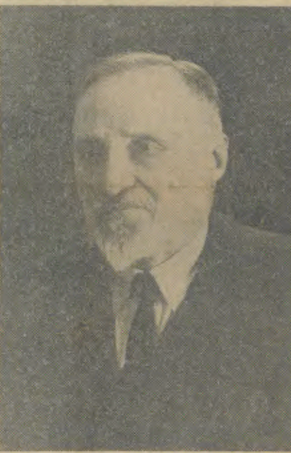
de Belas Artes do Porto.