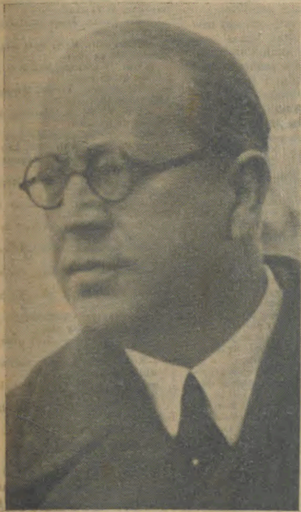
ENGENHEIRO CANCELA DE ABREU Ilustre Ministro do Interior