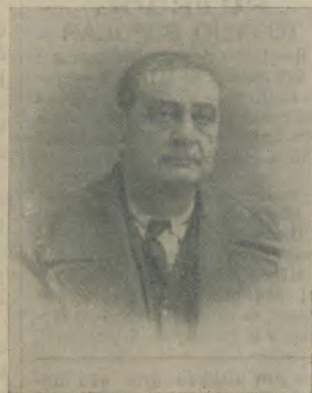
Outro nosso saudoso amigo e vigoroso colaborador que, no dia 8 de corrente, fez quatro anos que desapareceu do convívio de sua dedicada familia e dos seus numerosos amigos. Como recordar á viver, aqui lembramos a memoria desse distinto Médico e barcelense ilustre que tã relevantes Serviços prestou á Humanidade sofredora.