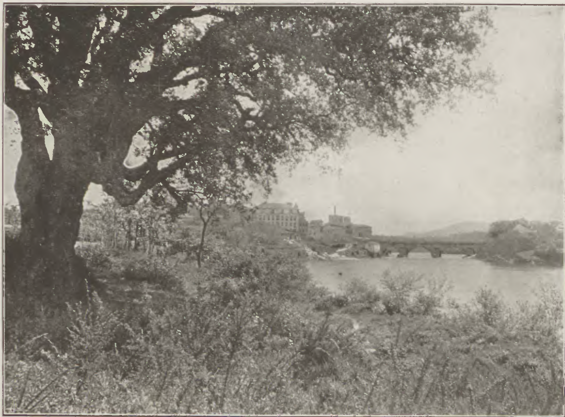
Um trecho da paisagem barcelense, inspirador de versos de Fogaça...