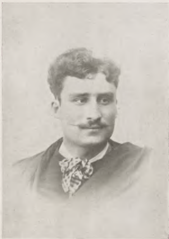
○ Poeta António Fogaça (1863 — 1888)