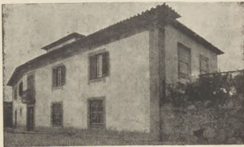
CASA ONDE NASCEU O POETA (subúrbios de Barcelos)

Um ano correu. Ao cabo, transportou-se com os seus para Coimbra, a acabar os preparatórios para se matricular na Universidade (5).