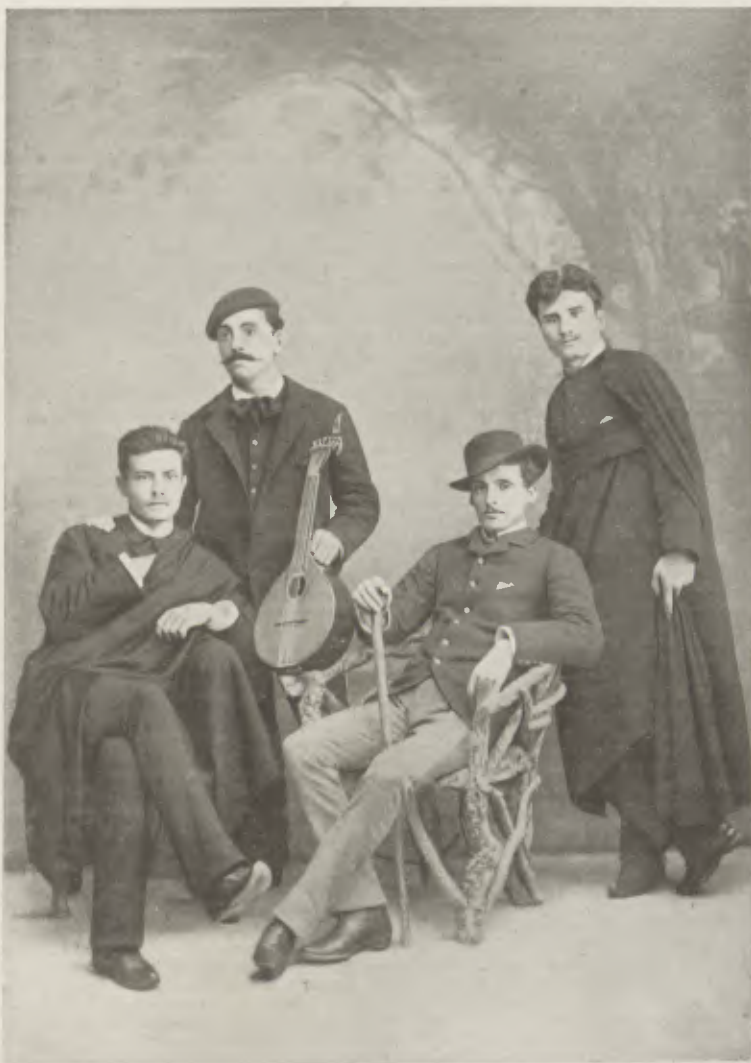
O Poeta (de pé, à direita) com um grupo de condiscípulos e amigos íntimos, em Coimbra