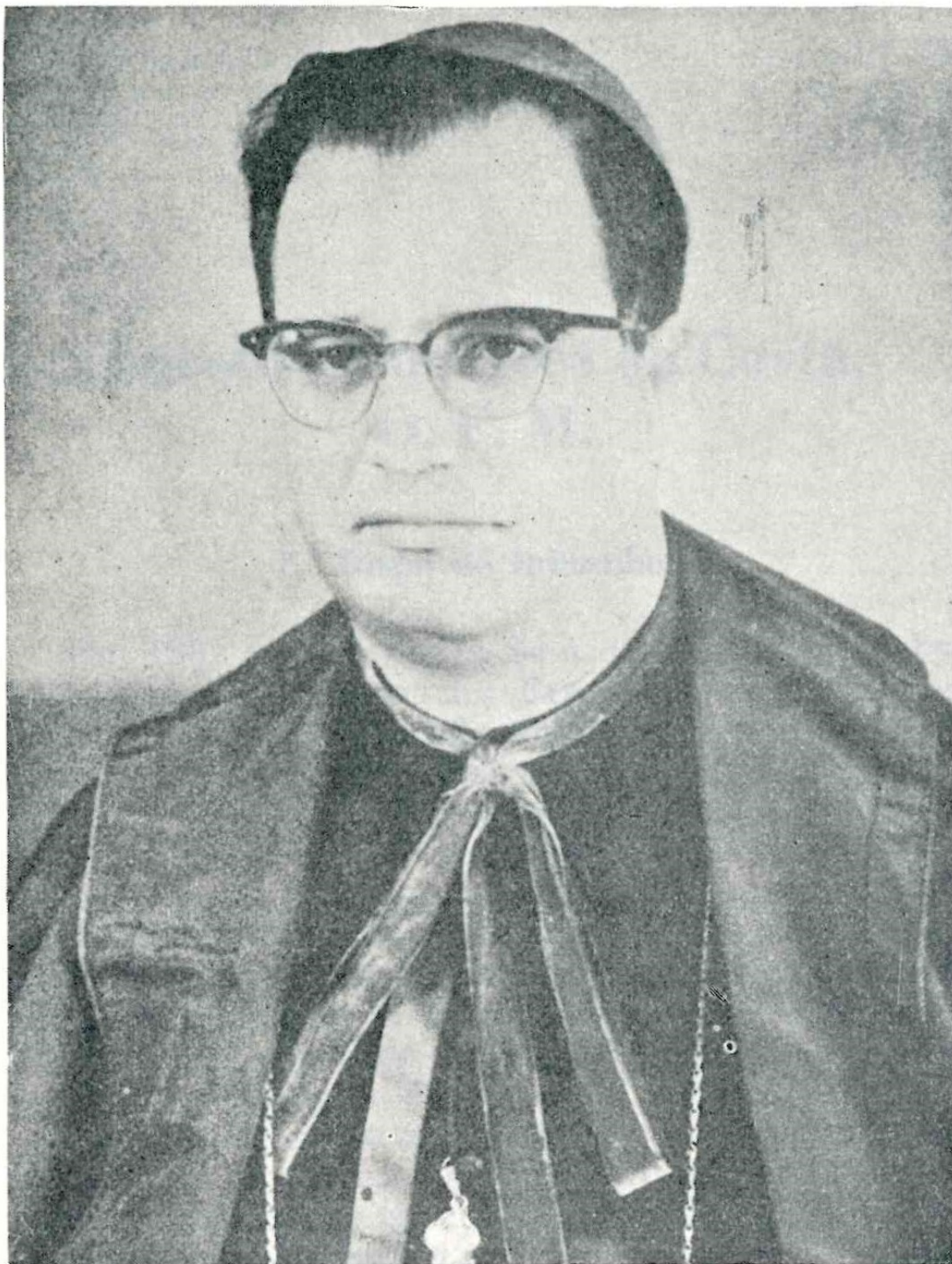
D. Ernesto Gonçalves — Bispo de Faro