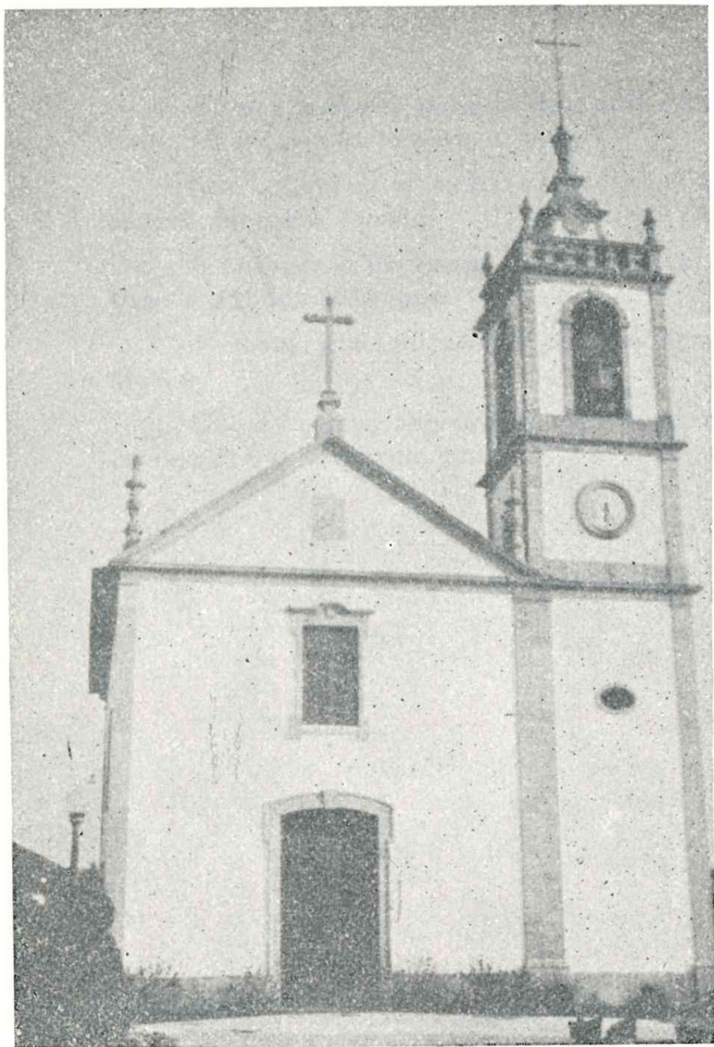
Igreja paroquial de S. Romão da Ucha