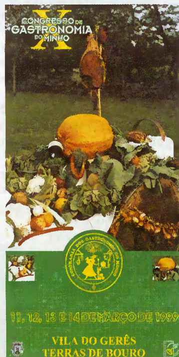
Cartaz do X Congresso de Gastronomia do Minho