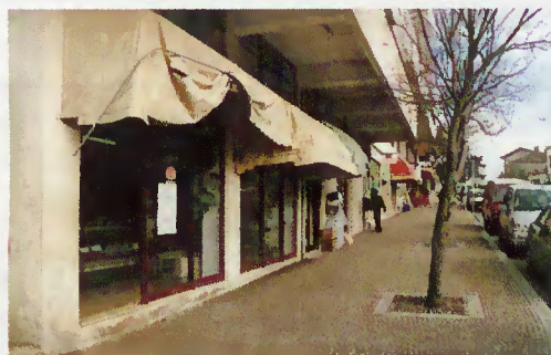
Vila de Terras de Bouro

Em Junho de 1998, a Câmara Municipal de Terras de Bouro e a Associação Comercial de Braga promoveram, em parceria e no âmbito do PROCOM, a candidatura de um projecto que visava a «Revitalização Comercial do Centro de Terras de Bouro». Este projecto, com uma estimativa orçamental de investimentos de cerca de 800 mil contos, dos quais 200 mil municipais, acaba de ser contemplado com