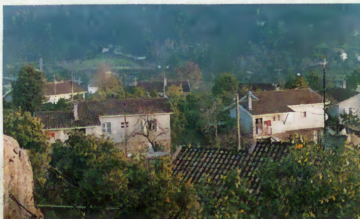
Bairro da Caniçada, em Paradela, Valdozende

Impressão: Oficinas Gráficas de Barbosa & Xavier, Limitada - Braga