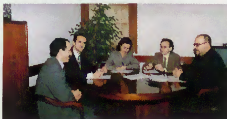
Técnicos do THERMAIOS na CMTB

Técnicos espanhóis do projecto THERMAIOS, um programa europeu que visa a revitalização de municípios com termas, reuniu em Terras de Bouro