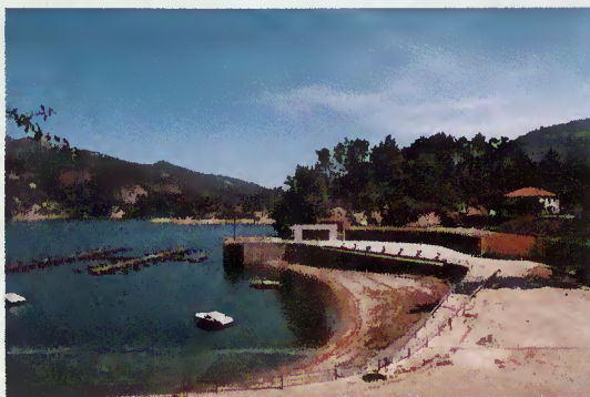
Barragem da Caniçada

Esta prova realizar-se-á nos dias 22 e 23 de Maio e será organizada pela Federação Portuguesa de Motonáutica com a colaboração da Câmara Municipal que, para o efeito, disponibilizará o Centro Náutico de Rio Caldo. Esperamos que seja mais um momento alto de divulgação turística da nossa região.