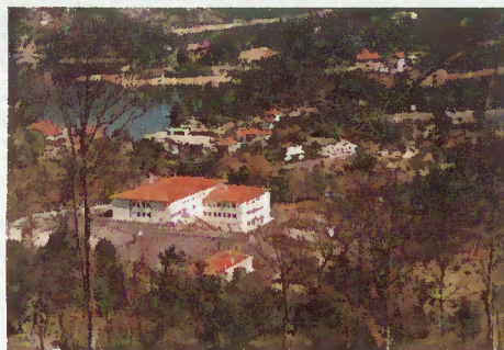
Escola Básica do 2.º e 3.º Ciclos de Rio Caldo

Finalmente, podemos informar que se encontram reunidas as condições em ordem à adjudicação da construção do pavilhão gimnodesportivo de Rio Caldo. Na audiência que o Secretário de Estado da Administração Educativa, Dr. Guilherme de Oliveira Martins, concedeu ao Presidente da Câmara no passado dia 27 de Janeiro, foi garantido o cofinanciamento desta obra por parte do Ministério da Educação através da