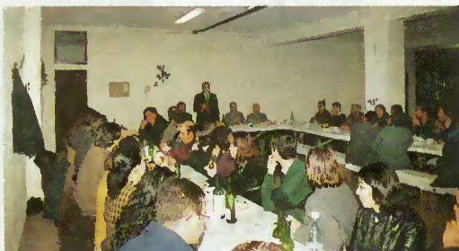
Almoço de Natal dos trabalhadores da CMTB

O senhor presidente, não obstante o convite para almoçar com a senhora Ministra do Ambiente no Centro de Animação Termal do Gerês, não quis deixar de partilhar com todos os trabalhadores este momento de convívio, tendo-lhes dirigido umas breves palavras de apreço e formulado votos de um óptimo Ano Novo.