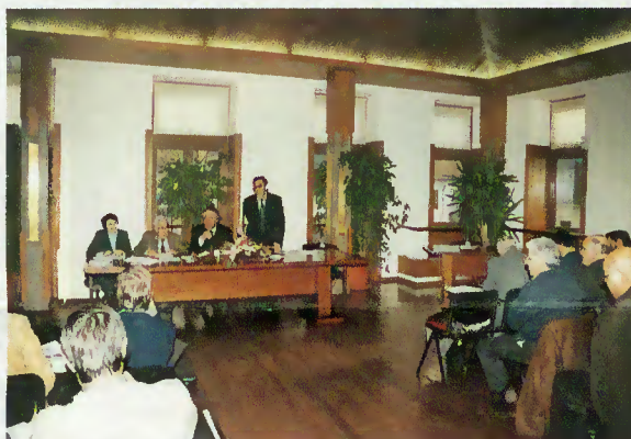
Sessão da Assembleia Municipal

social (loteamentos sociais, Gabinete Técnico de Apoio ao Munícipe, Projecto de Luta Contra a Pobreza e Centro Social de Cibões).