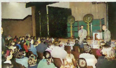
Festa de Natal dos filhos dos trabalhadores

Também os filhos dos trabalhadores da autarquia não foram esquecidos pelo executivo. A partir das catorze horas e trinta minutos, puderam assistir, no Centro Cultural, a um espectáculo teatral, A Bicicleta do Palhaço , uma pantomima que muito divertiu a pequenada, não obstante os palhaços terem utilizado, apenas, a linguagem gestual. Ao espectáculo teatral, seguiu-se a