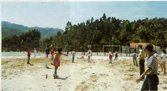
Local destinado à construção do pavilhão gimnodesportivo