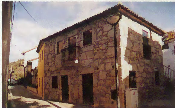
Edifício do Arquivo Municipal