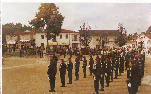
Recepção ao Secretário de Estado