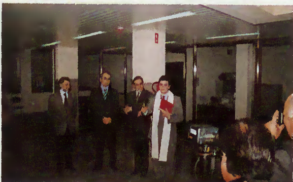
Bênção das instalações do Centro de Animação Termal do Gerês

A visita terminou com um almoço servido nas instalações do Centro de Animação Termal do Gerês.