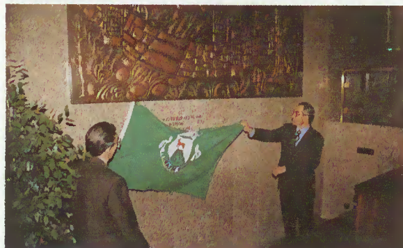
Descerramento da lápide nos Paços do Concelho