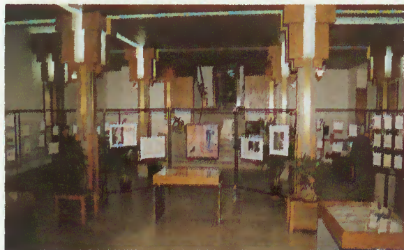
Exposição bibliográfica e de pintura dos Autores Terrabourenses