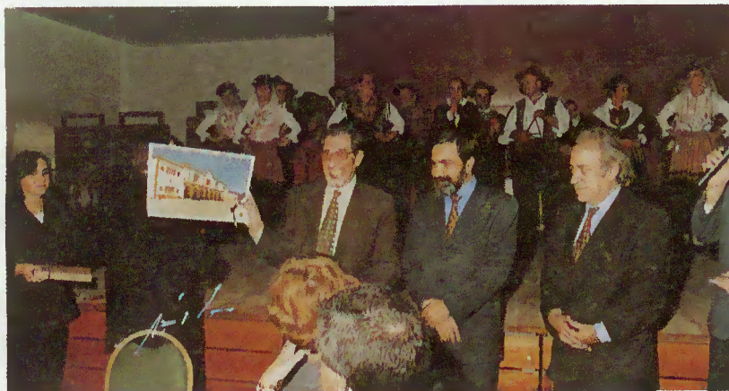
Organização distingue Câmara Municipal e Região de Turismo

Outros eventos de impacto nacional estão a ser organizados pela Região do Turismo do Alto Minho em colaboração com a Câmara Municipal. Trata-se do IX Congresso de Gastronomia a realizar durante o próximo mês de Março e que decorrerá no Centro de Animação Termal do Gerês.