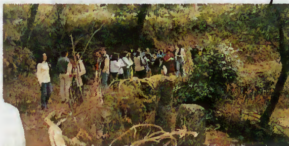
Professores e Educadores visitam a Geira

Com o objectivo de proporcionar aos docentes de todos os níveis de ensino que leccionam em escolas do Concelho, em especial aos que aqui foram colocados pela primeira vez, um conhecimento mais profundo da realidade sócio-económica e geográfica de Terras de Bouro, a Câmara Municipal organizou, no passado dia 11, a "Recepção ao Professor", cujo programa incluiu uma visita ao concelho, nomeadamente, à Via Romana, à Casa dos Bernardos, ao Centro Náutico de Rio Caldo, à Escola E.B. 2,3 de Rio Caldo (almoço), ao Centro de Animação Termal do Gerês e ao Museu Etnográfico de Vilarinho da Furna.