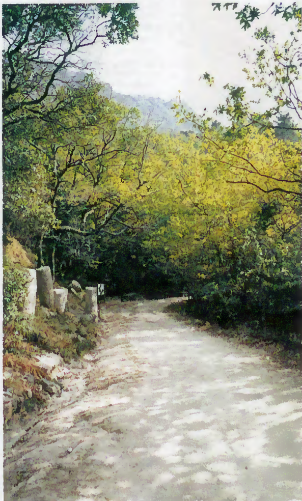
Marcos Milários e Via Romana na Mata de Albergaria

Ao longo dos últimos anos, o direito à informação por parte de todos os munícipes foi relegado para segundo plano dado existirem carências básicas a nível de vias de acesso, electricidade, água, saneamento, etc. Actualmente, e fruto de uma boa gestão, é possível augurarmos um futuro mais risonho para as novas gerações, onde os padrões de qualidade se impõem. Assim, agora a aposta é na melhoria da qualidade de vida dos terrabourenses.