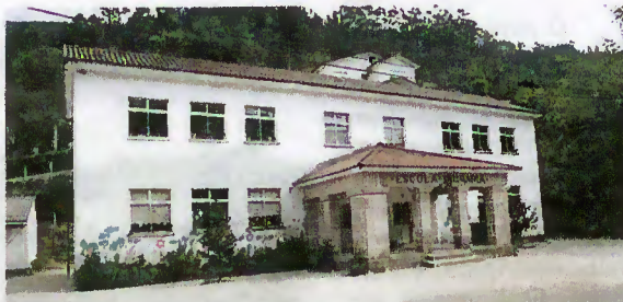
Escola do 1.º Ciclo do Ensino Básico, Gerês

Nas obras de recuperação dos edifícios escolares do 1.º ciclo, realizadas durante o período de férias escolares foram investidos, aproximadamente, 4.000 contos.