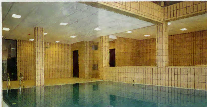
Piscina Municipal no Centro de Animação Termal do Gerês

a autarquia está a equacionar a possibilidade de serem ministradas, aos alunos, aulas de natação na piscina municipal situada no Centro de Animação Termal do Gerês.