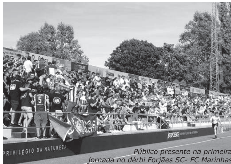
Público presente na primeira jornada no dérbi Forjães SC- FC Marinhas

Neste momento o Forjães SC encontra-se na quinta posição da tabela classificativa com 4 pontos, deslocando-se na quarta jornada do Campeonato Pro Nacional da AF de Braga ao terreno do AFC Martim. O Forjães SC conta com o apoio de toda a família FSC para este jogo.