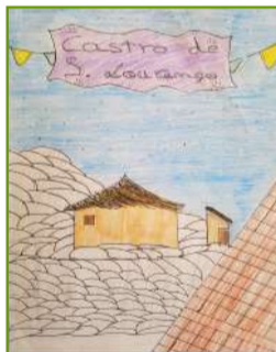
Ilustração: Cátia Cunha

A partir da visita de estudo foram construídos alguns textos e trabalhos, como a imagem documenta, entre outros.