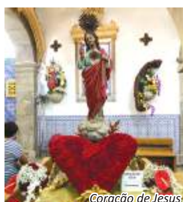
Coração de Jesus