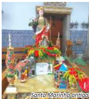
Santa Marinha antiga