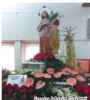
Santa Maria Goretti