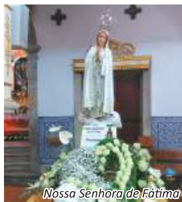
Nossa Senhora de Fátima