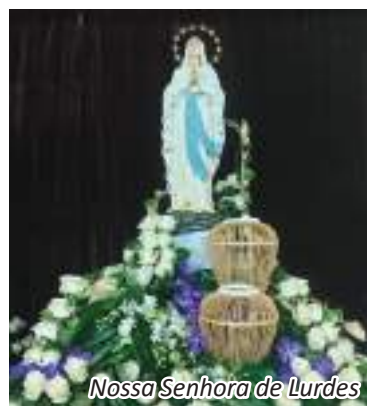
Nossa Senhora de Lurdes