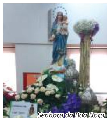
Senhora da Boa Hora