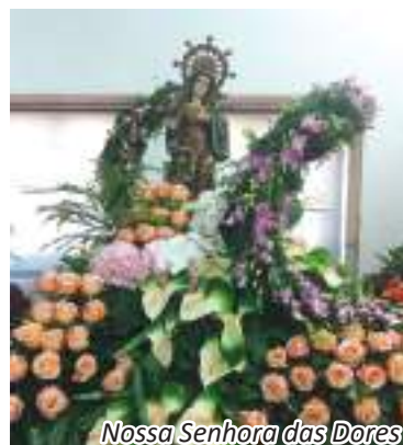
Nossa Senhora das Dores