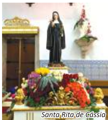
Santa Rita de Cássia