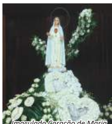
Imaculado Coração de Maria