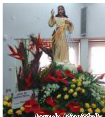
Jesus de Misericórdia