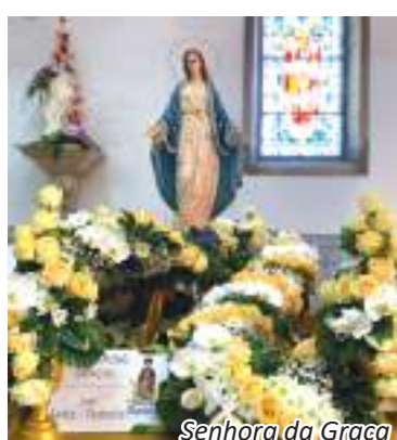
Senhora da Graça