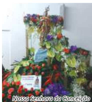
Nossa Senhora da Conceição