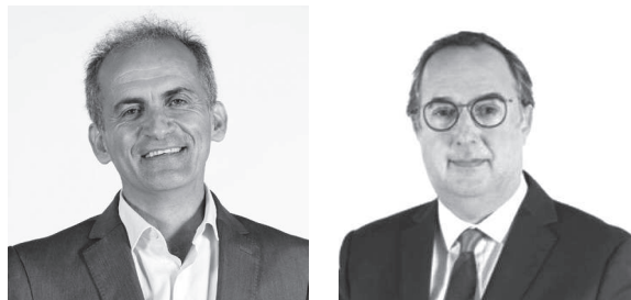
Luís Peixoto Câmara Municipal