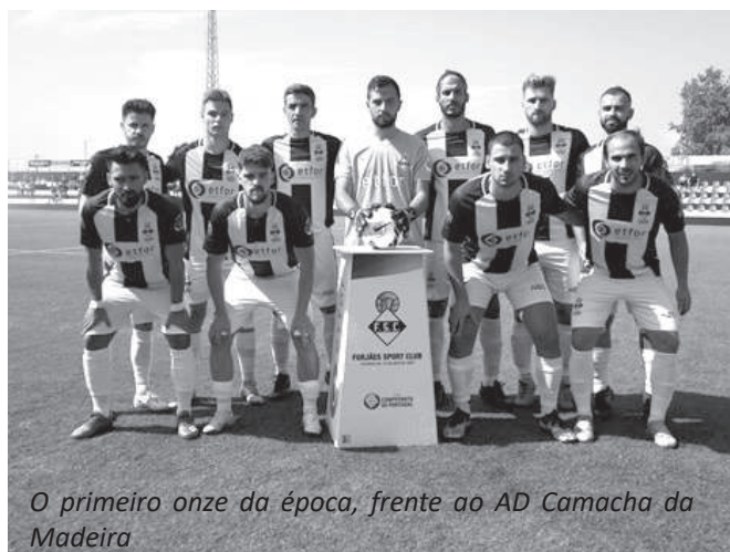
O primeiro onze da época, frente ao AD Camacha da Madeira