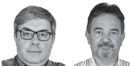
Paulo Martins Câmara Municipal