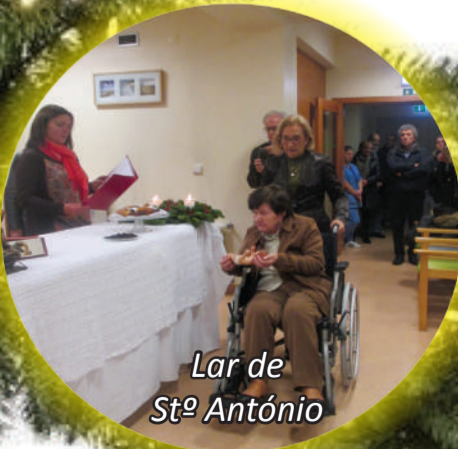
Lar de Stº António