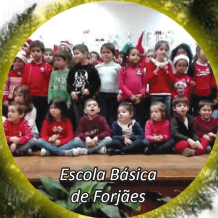
Escola Básica de Forjães