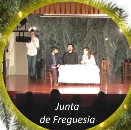
Junta de Freguesia