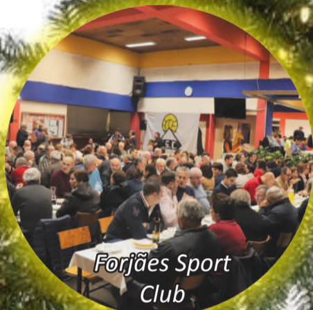
Forjães Sport Club

Rua da Corujeira, 98 | 4740-432 Forjães Tel. 253 876 000 | Tlm. 964 236 010 culizende@hotmail.com