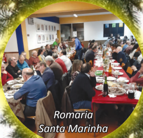
Romaria Santa Marinha