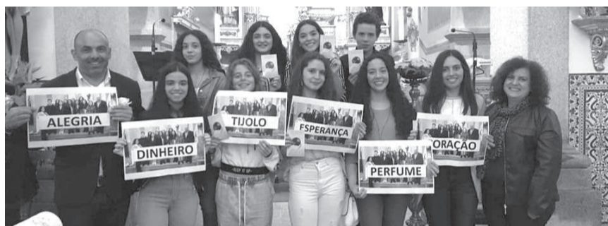
Primeira comunhão - 3ºano - 15-06-2019