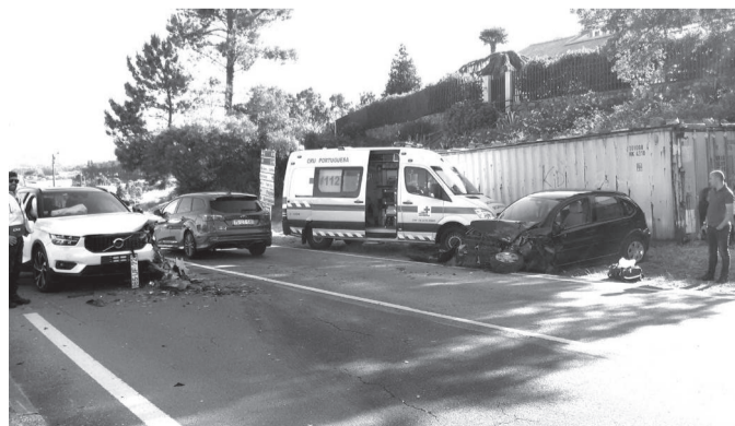
A GNR de Esposende tomou conta da ocorrência.

O mês de junho registou um acidente. No dia 11 de junho a estrada nacional 103, na chamada "curva do Alcino Pereira", um choque frontal entre duas viaturas resultou num ferido ligeiro, que foi conduzido pelo INEM ao hospital de Barcelos. A viatura que seguia no sentido Barcelos-Viana, era conduzida por um jovem de Celeirós que se dirigia para o seu trabalho na zona industrial de Neiva. Segundo o próprio, ele terá adormecido e na referida curva entrou em despiste e invadiu a faixa contrária, provocando também danos materiais muito avultados.