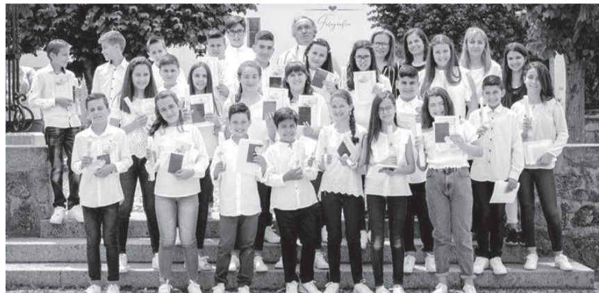
Festa do Espírito Santo - 9ºano - 08-06-2019