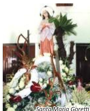
Santa Maria Goretti