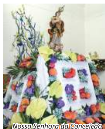
Nossa Senhora da Conceição