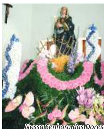
Nossa Senhora das Dores