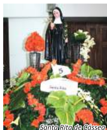
Santa Rita de Cássea