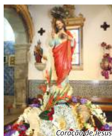
Coração de Jesus