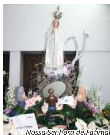
Nossa Senhora de Fátima