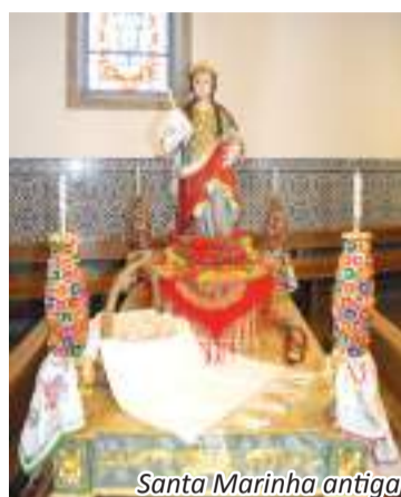
Santa Marinha antiga

É o nosso tributo a todos os forjanenses, a todos aqueles que, de alguma forma, contribuíram para a realização das festividades.