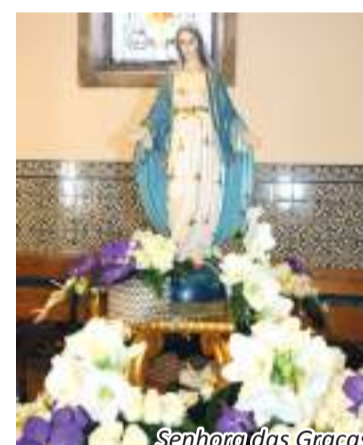
Senhora das Graças