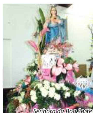
Senhora da Boa Sorte