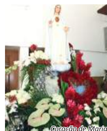
Coração de Maria