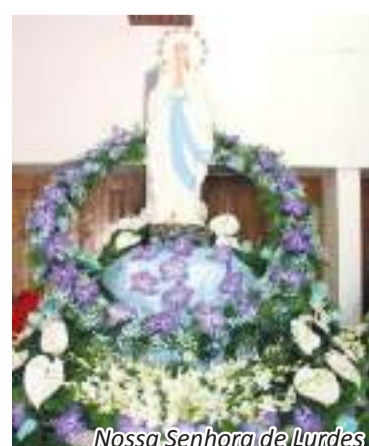
Nossa Senhora de Lurdes