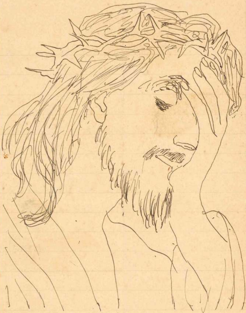
Jesus Christo (Enadro de Juan Sycki)