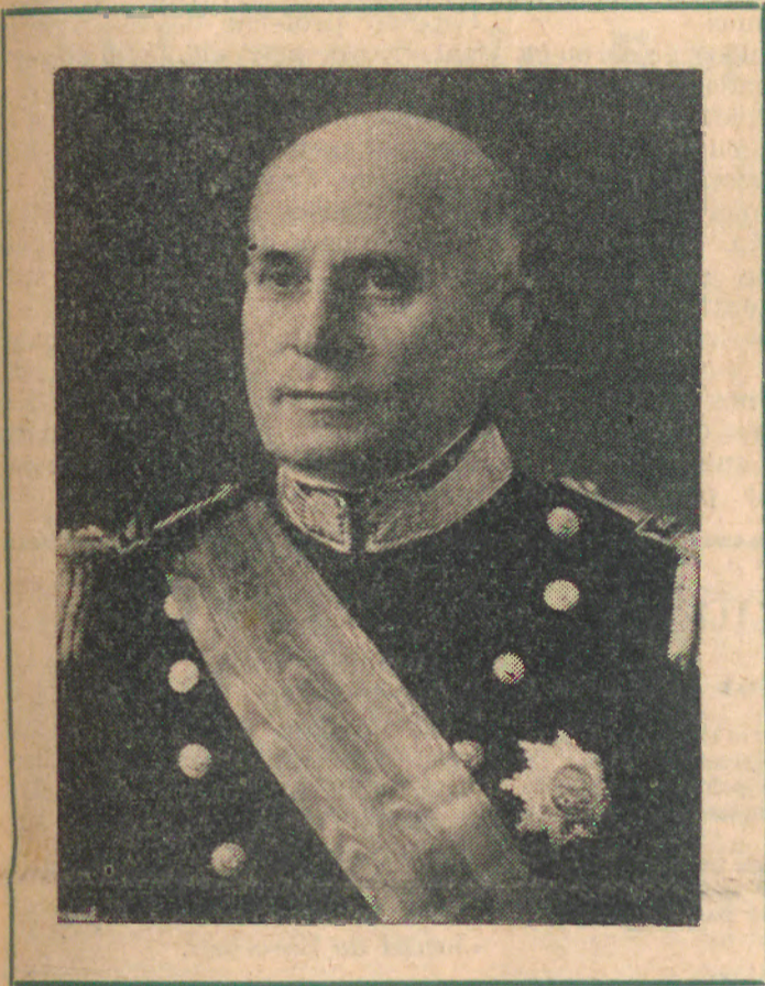
Almirante Américo Rodrigues Tomás

Tomás, na sua passagem por Barcelos. No domingo próximo, certamente que esse entusiasmo irá atingir um ponto mais alto ainda, uma vez que a nossa terra é honrada com a presença do venerando Chefe do Estado numa inauguração oficial.