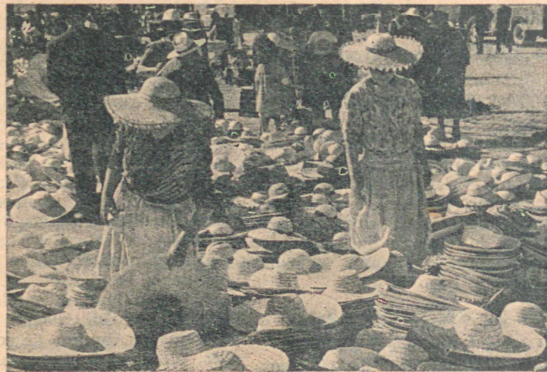
A FEIRA FRANCA — Cartaz vivo e alegre, onde se transaccionam os cereais, os utensílios de lavoure, a cerâmica e todo o artesanato desta nossa Região.

Publicamos hoje, seguida de uma nota informativa emanada da Comissão das Festas das Cruzes, o programa-resenha dos próximos festejos citadinos, este ano levados a efeito pela Comissão Municipal de Turismo em íntima colaboração com a Câmara Municipal. O programa definitivo, em vias de conclusão, está ainda pendente de diversos factores alheios à vontade da Comissão, o qual espera, no entanto, distribuí-lo dentro de curto prazo.