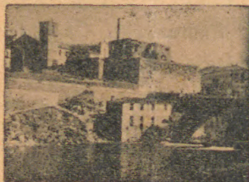
S RUINAS DOS VELHOS PAÇOS DUQUES-DUQUES DE BARCELOS

Tal como disse o Prof. Vitorino Nemésio, presidente da Comissão Nacional das Comemorações oficiais, «este programa das celebrações do V Centenário de Gil Vicente — resolvidas, à falta de prova cronológica do nascimento do poeta, para um ano provável, induzido da idade que ele teria alcançado ao fechar as suas contas com uma vasta obra — visa simplesmente a fortalecer a consciência a grandeza de tal homem e da sua rara mensagem no português.»