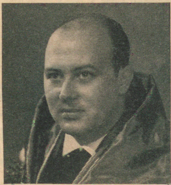
Professor GONÇALVES DE PROENÇA Ilustre Ministro das Corporações

Conforme havíamos já noticiado, Sua Excelência o Ministro das Corporações e Previdência Social desloca-se a Barcelos, no próximo sábado, dia 19 do corrente, a fim de proceder a várias inaugurações oficiais.