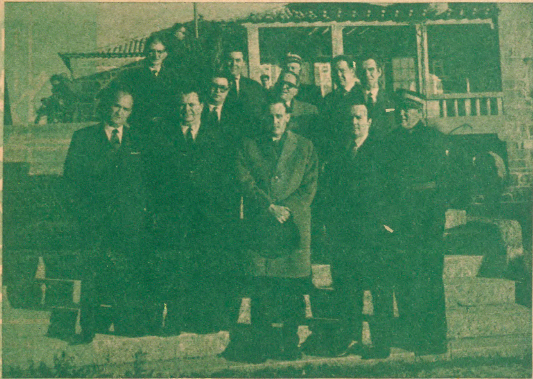
Na Franqueira, o Presidente da Liga dos Bombeiros Portugueses ladeado pela actual Direcção e Comando dos Vol. de Barcelos