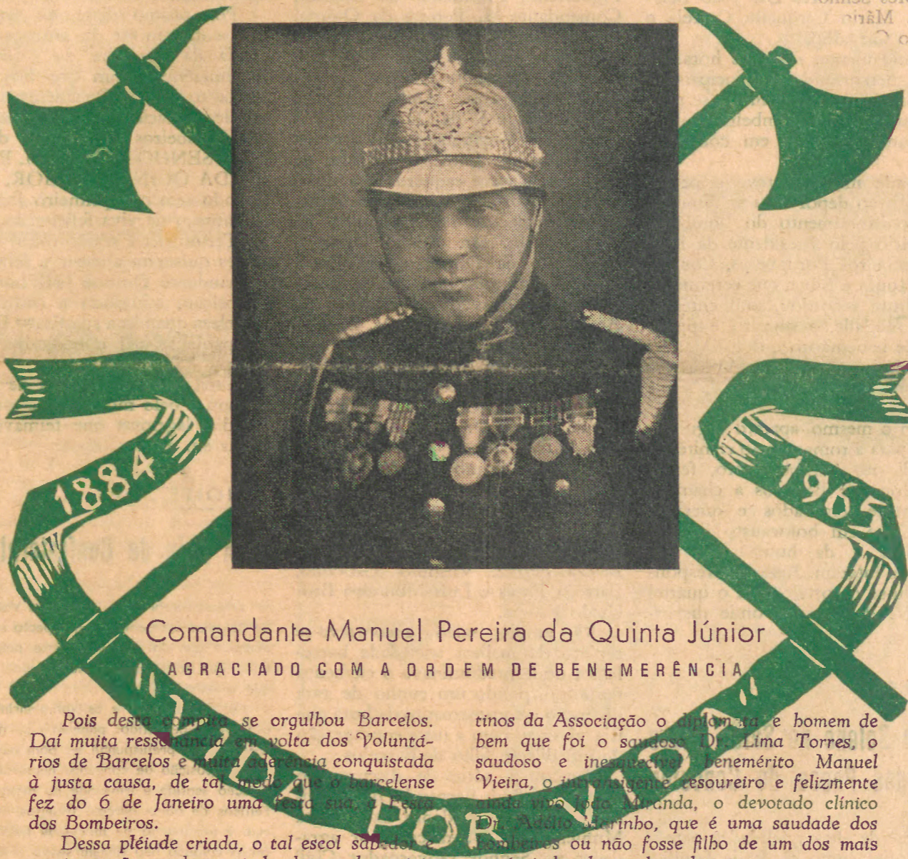
Comandante Manuel Pereira da Quinta Júnior

E não foram só os barcelenses os surpreendidos. Foram todos os portugueses que militavam a favor dos Voluntários, tal a desenvoltura experimentada em incêndios como em simulacros de pura exibição de técnica, em que eram solicitados para um melhor aperfeiçoamento.