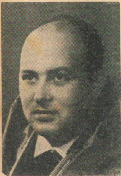
DR. GONÇALVES DE PROENÇA Ministro das Corporações

B ARCELOS vai receber no próximo domingo, dia 22, a visita de Sua Excelência o Sr. Ministro das Corporações e Previdência Social, Sr. Dr. Gonçalves Proença, que vem presidir à inauguração de 3 Casas do Povo, acontecimento que represente um passo mais