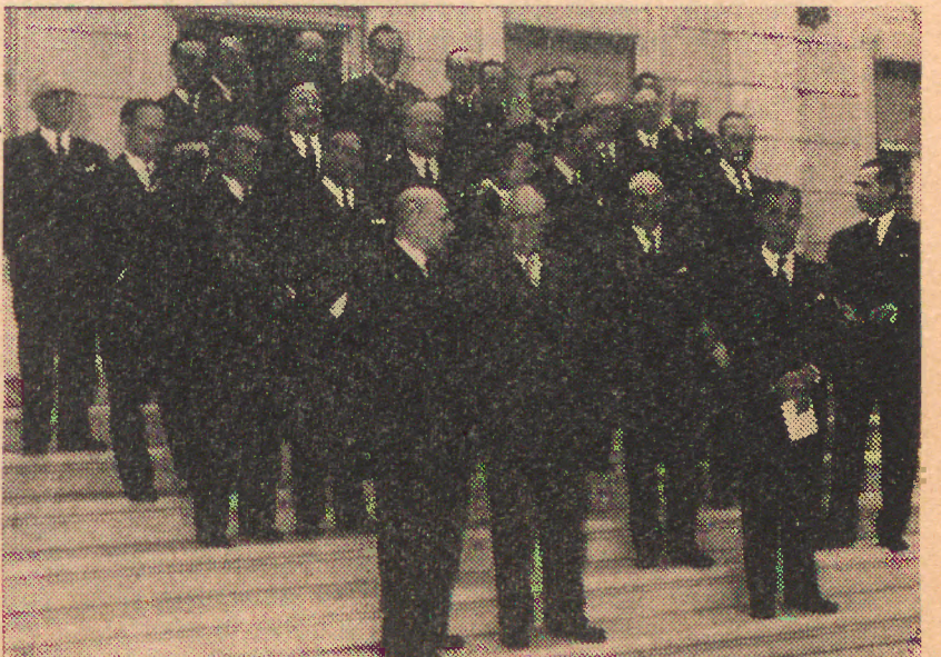
O Senhor Presidente do Conselho reunido com os membros do Governo que lhe foram apresentar cumprimentos pela passagem do 33.º aniversário de acção governativa

Comecei por isso a interrogar-me sobre as razões que poderiam explicar a escolha feita. Não encontrei muitas — mas algumas existem por certo, e estas não deixarão de