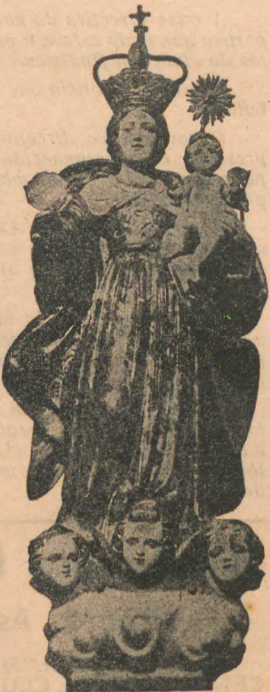
Nossa Senhora da Franqueira

Em seguida: Procissão Eucarística e bênção do Santíssimo Sacramento.