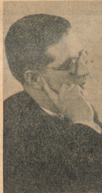
P.º Benjamim Salgado

Na verdade, isto que a muita gente poderia passar despercebido tem real valor por obrigar o A. a um esforço muito maior e a um ex-