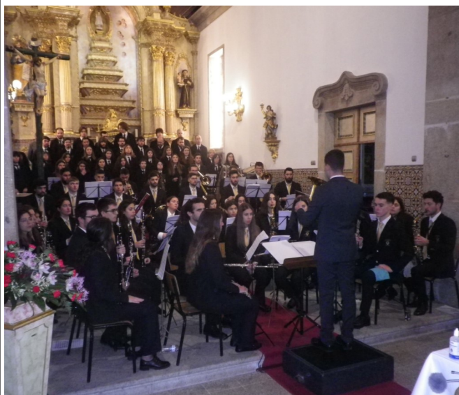
A Banda de Belinho e o Orfeão Universitário do Porto