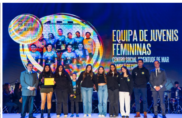
A equipa de Juvenis de andebol feminino do Centro Social da Juventude de Mar foi campeã regional.