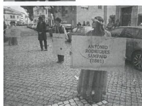
O Cortejo evocou a figura ímpar do mareense António Rodrigues Sampaio