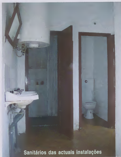
Sanitários das actuais instalações

Nesta conversa, o governante mostrou sensibilidade para a resolução deste problema, assumindo a vontade política de incluir esta obra no PIDDAC de 2004, com uma verba capaz de dar satisfação a esta pretensão.