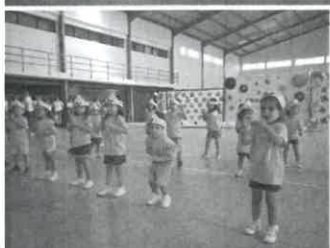
Fotos: Sala dos Bebés; 2 anos; 3 anos; 4 anos e 5 anos. (Finalistas).