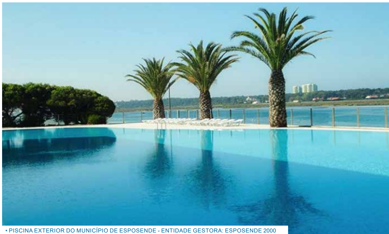
• PISCINA EXTERIOR DO MUNICÍPIO DE ESPOSENDE - ENTIDADE GESTORA: ESPOSENDE 2000

Desde o século XX, com a consciencialização dos benefícios para a saúde intrínsecos à utilização das piscinas, a procura por este tipo de instalações sofreu um aumento gradual e significativo.