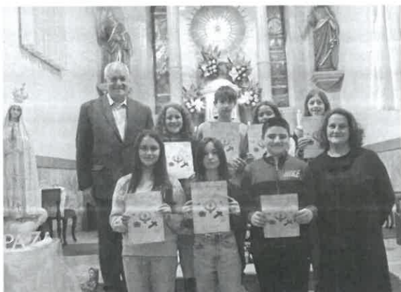
Adolescentes do 7º ano e sua animadora

No passado dia 21 de maio, na igreja paroquial de S. Bartolomeu do Mar, sete adolescentes que, no ano de catequese que findou, frequentaram com assiduidade e aproveitamento a catequese paroquial do sétimo ano celebraram a Festa das Bem-Aventuranças. Na mesma celebração eucarística, quatro adolescentes do nono ano celebraram a Festa do Compromisso.