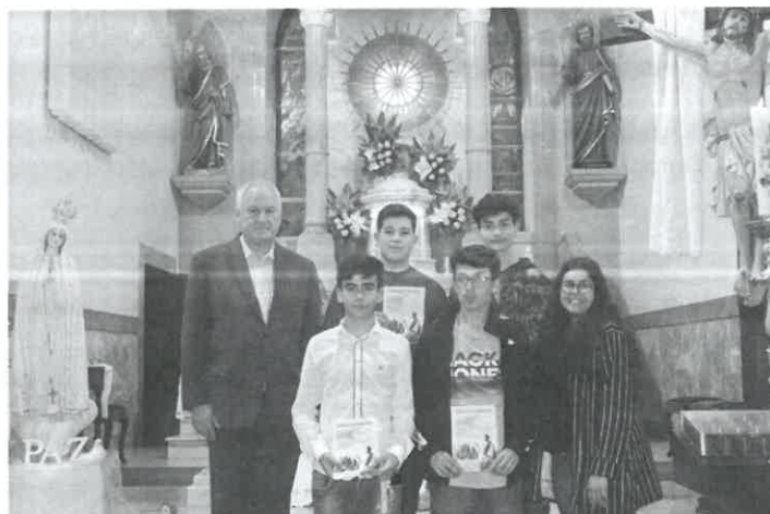
Adolescentes do 9º ano e sua animadora