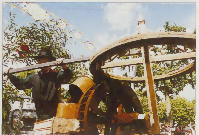
Rega do milho utilizando a "Nora"

ST. o MARIA DA TORRE - Trouxe-nos um carro alegórico muito bem concebido, com a qualidade e a originalidade a que aquela freguesia já nos habituou; representando um processo