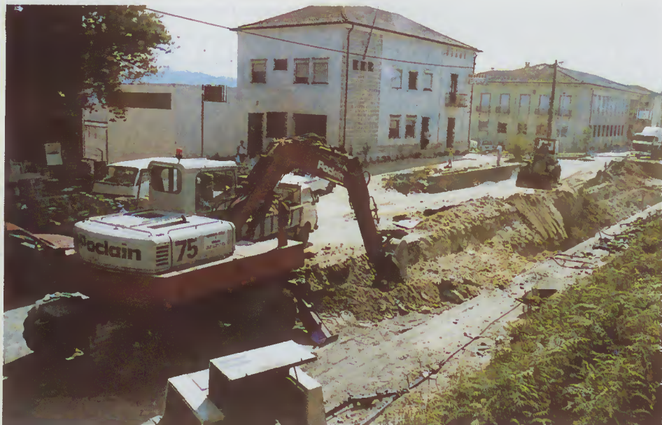
Aspecto das obras da empreitada do prolongamento da conduta geral de abastecimento de água desde Ferreiros até Figueiredo e a colocação dos colectores para o saneamento em Amares.