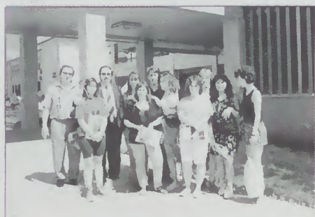
Recepção a jovens estudantes franceses que visitaram o concelho