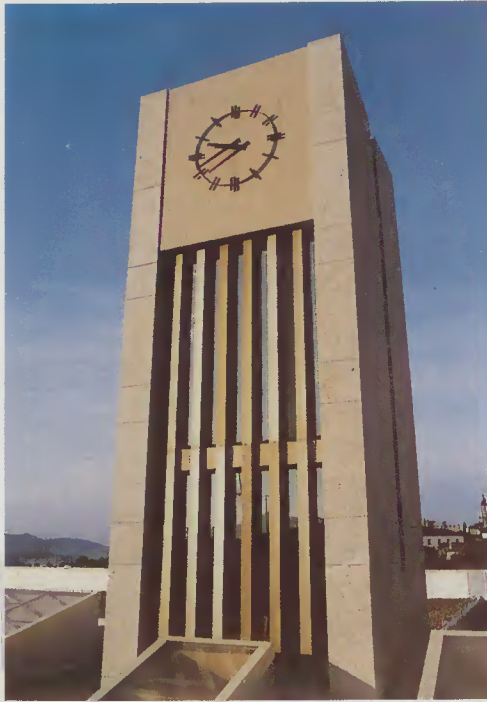
Torre do Relógio