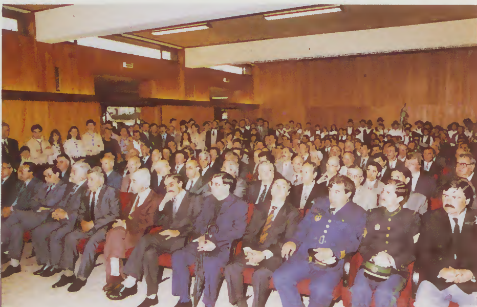
Aspecto geral das cerimónias comemorativas