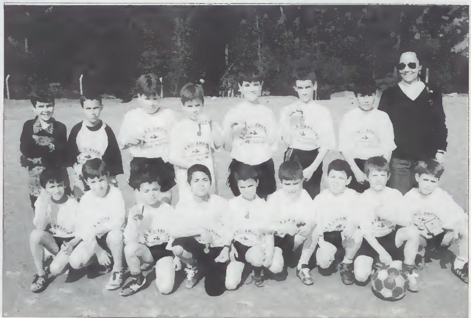
Equipa da Escola Primária de Amares

Foram entregues prémios aos participantes para o que contou a colaboração da Edilidade e comércio locais.