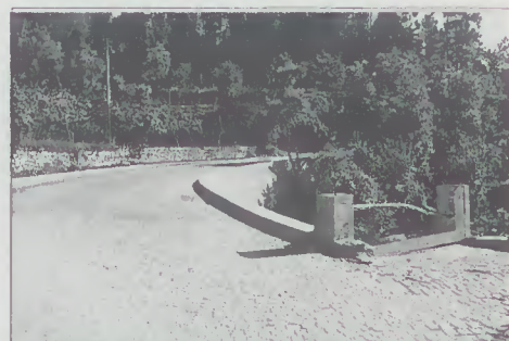
Rectificação da Curva E.M. Caires - P. Secas

REPAVIMENTAÇÕES EM VÁRIOS LOCAIS DO CONCELHO