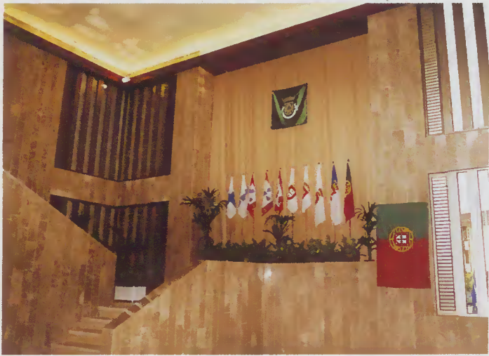
Átrio da entrada