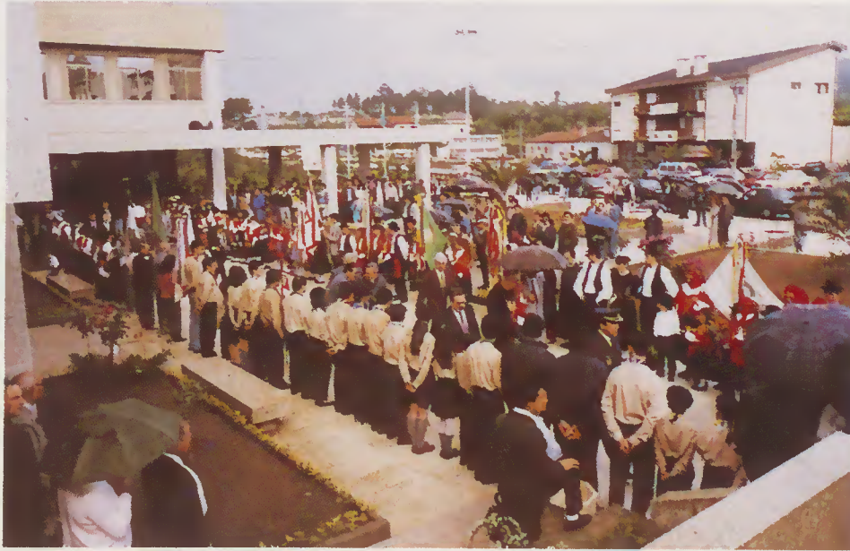
As Associações concelhias estiveram presentes na cerimónia

No período da tarde não faltou a festa minhota com a realização de um festival folclórico em que participaram todos os Ranchos Folclóricos do Concelho e o Rancho Folclórico de S. Pedro de Rates - Póvoa de Varzim.