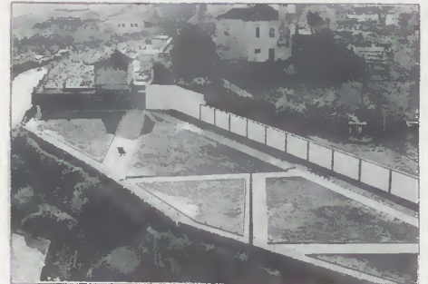
Cemitério da Ponte do Porto