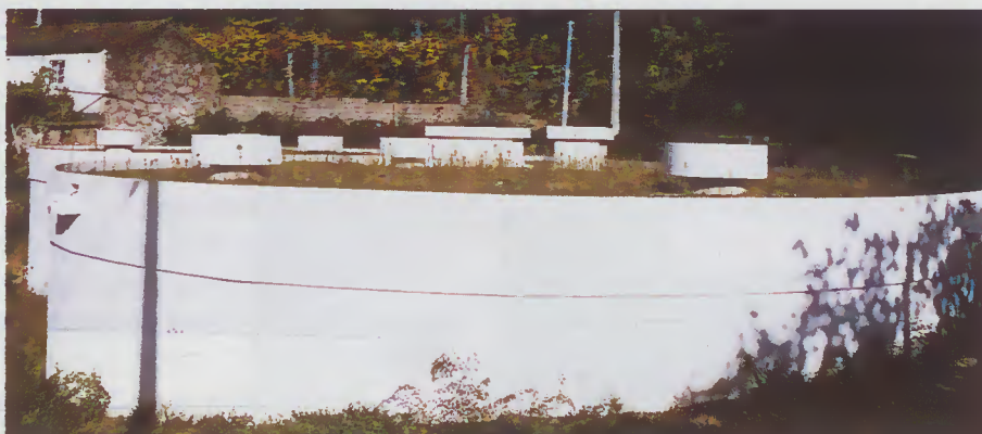
Reservatório de Besteiros - Lugar do Carvalhó

A conclusão dos dois reservatórios de água, já em pleno funcionamento, bem como as condutas gerais e ramais de acesso, eram prioridades para resolver o problema da falta de água nos meses de Verão.