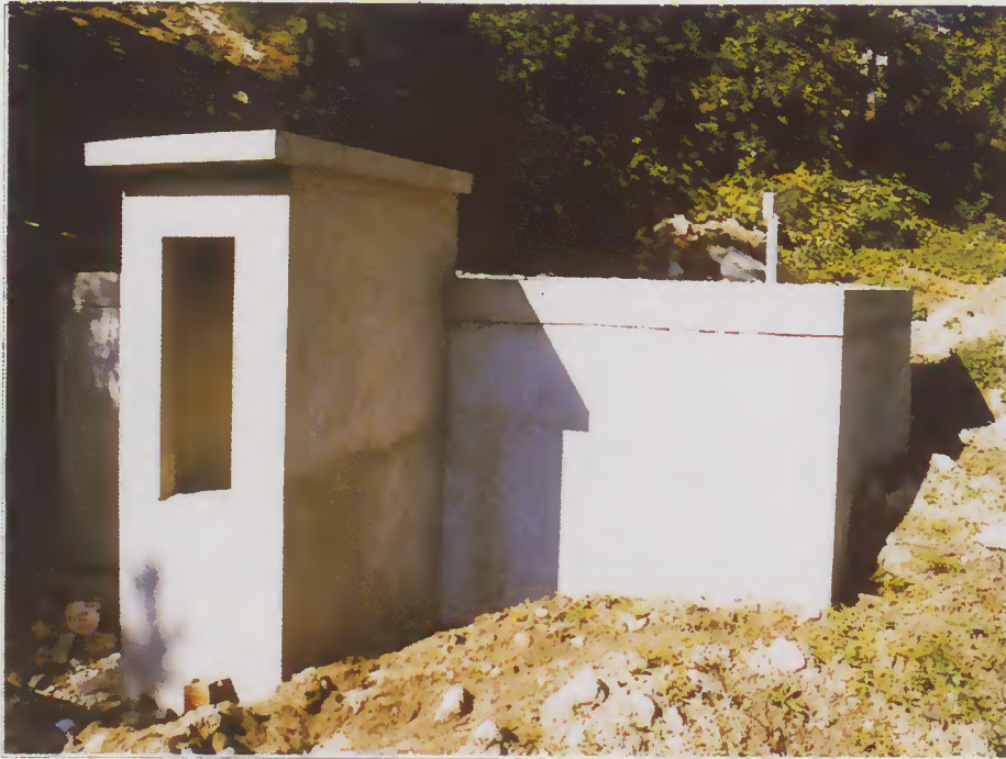
Reservatório de Caires

Deste reservatório partem a conduta principal e as derivações necessárias para a instalação dos ramais domiciliários.