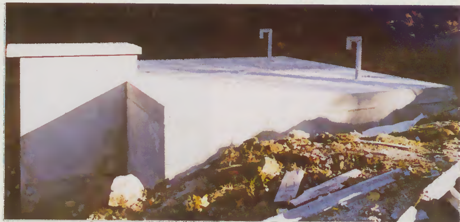
Reservatório de Caldeias