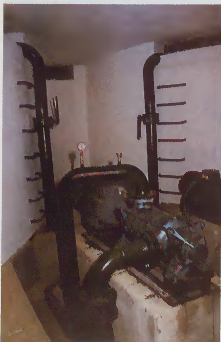
Sistema de bombagem