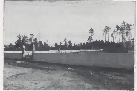
Cemitério de Ferreiros

Também a freguesia de Ferreiros passou a dispor, recentemente, de um amplo espaço, no seu Cemitério, já há muito tempo esperado.