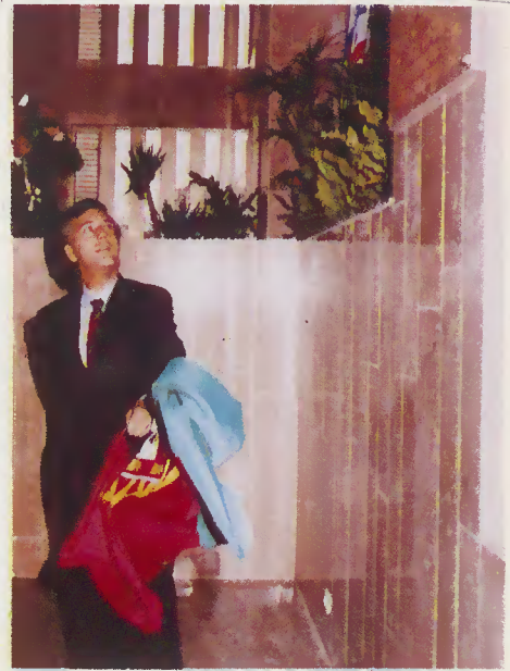
Descerramento da placa pelo Sec. Est. da Administração e Ord. do Território