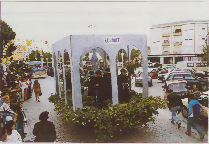
A Vida outrora no Mosteiro de Rendufe