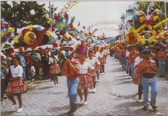
Grupo de Marchas de Santo António

Na marcha participaram 64 jovens para quem dirigimos aqui os nossos agradecimentos e também os nossos parabéns pela sua persistência, pelo seu trabalho e pelas agradáveis exibições com que, no dia 10 de Junho, participando no Cortejo Etnográfico e, na noite de St. o António muito contribuíram para a alegria dos Amarenses e numerosa população forasteira.