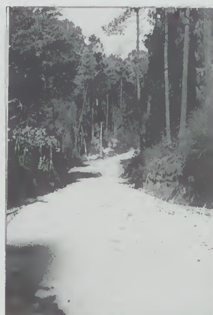
Abertura e pavimentação do Caminho do Pilar - Fiscal