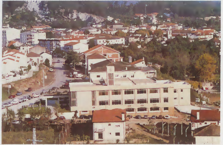
Panorâmica do edifício