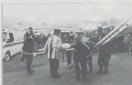
Exercício de evacuação das Esc. Sec. e Preparatória - "SISMEX / 93"

Esta foi mais uma das acções desenvolvidas pelos Serviços de Acção Socio-Cultural desta Câmara, o que contribuirá para um desenvolvimento saudável das crianças do nosso Concelho, combatendo o desfazimento existente em relação às crianças das grandes zonas urbanas.