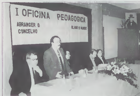
"I Oficina Pedagógica" apoio à formação de professores