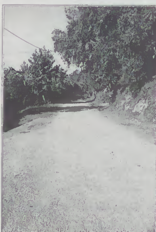
Lugar de Seramil