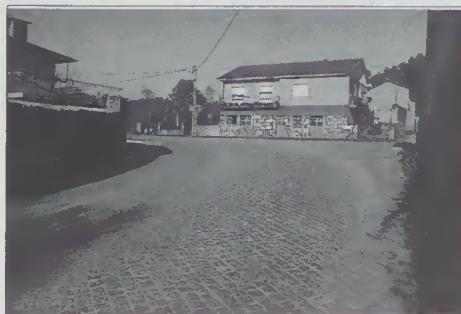
Rectificação da Curva do Mosteiro - Rendufe

Este novo caminho vai permitir uma futura circulação rodoviária de acesso ao santuário, proporcionando uma panorâmica extraordinária, contribuindo, assim para o enriquecimento da oferta turística do concelho de Amares.