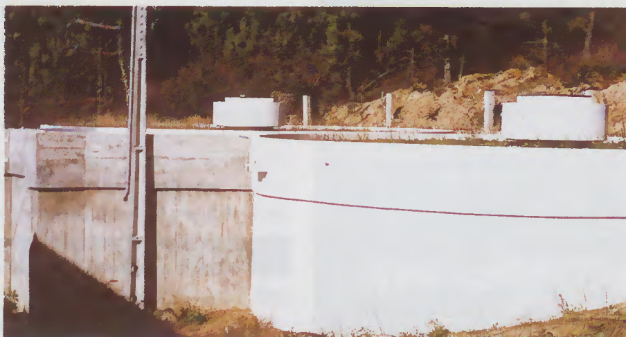
Reservatório de Besteiros - Lugar do Monte