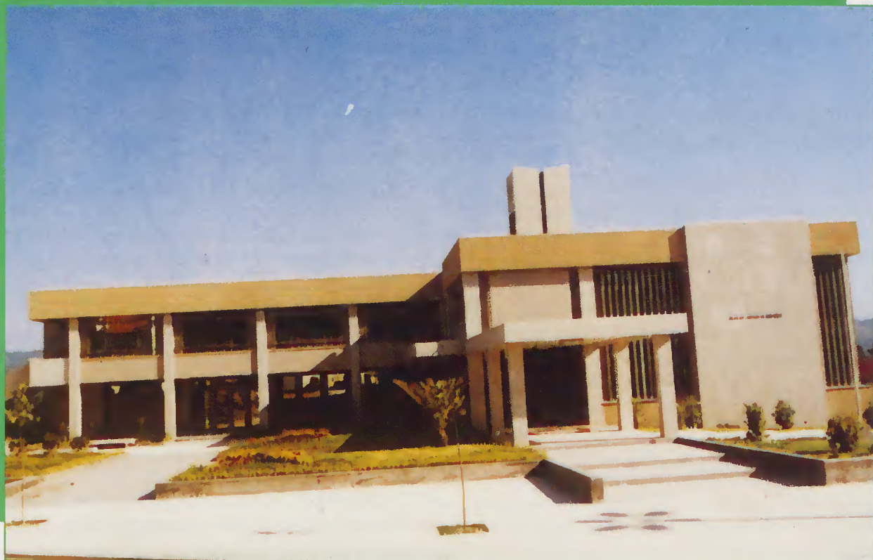
NOVOS PAÇOS DO CONCELHO