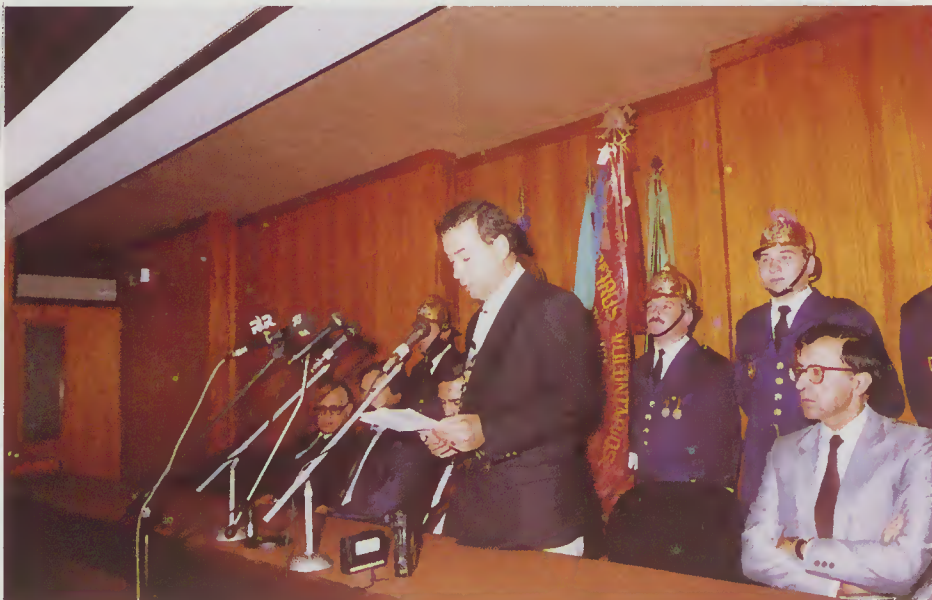
O Snr. Presidente da Câmara no uso da palavra