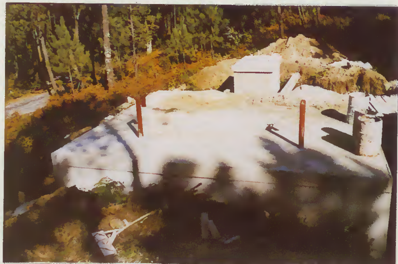
Reservatório de Fiscal

O abastecimento de água ao concelho de Amares, tem sido alargado decididamente. Hoje todas as freguesias estão praticamente abastecidas de água, quer por aproveitamento de minas, furos artesianos ou reforço da rede de abastecimento servido pela captação no Rio Homem, com a construção do reservatório de Caldeias e Fiscal, nos lugares da Sernadela e Pilar respectivamente, resolvemos e alargamos o abastecimento a estas localidades. Mas os esforços desta Câmara Municipal não ficam por aqui, vão arrancar as obras de construção do reservatório de Portela e Besteiros para que, também estas freguesias fiquem com o problema da água resolvido.