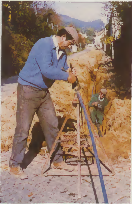
Colocação de novos ramais de água