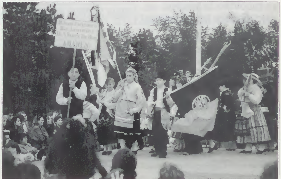
Rancho de S. Vicente do Bico em França

Garantir melhores saídas profissionais aos jovens e reduzir a desertificação dos Concelhos Rurais, são alguns dos objectivos deste novo Centro de Formação.