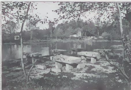
Praia Fluvial da Malheira

da freguesia de Seramil. Estão já a ser recuperadas algumas habitações, através do projecto LEADER, com destino ao Turismo Rural, permitindo à freguesia rentabilizar as suas potencialidades turísticas, garantindo o escoamento dos seus produtos agrícolas e a fixação da população.