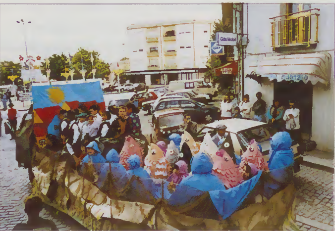
Sermão de Santo António aos Peixes

Vejamos, agora a mensagem cultural dos carros Alegóricos das freguesias e outras instituições que com brio e muita dignidade, se fizeram representar nas Festas do Concelho.