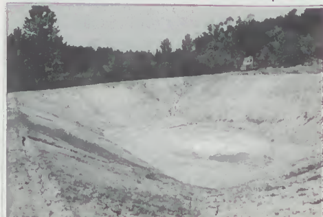
Construção da ETAR