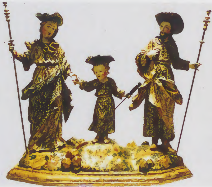
Sagrada Família séc. VIII - Mosteiro Santo André - Rendufe