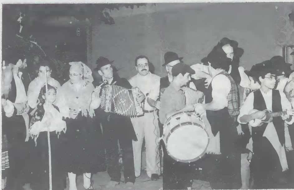
Animação termal em Caldelas

4 - Rancho Folclórico de Lago. 8 - Passeio turístico a Rendufe e Abadia. 11 - Rancho Folclórico St.ª M.ª da Torre 12 - Grupo de Cavaquinhos da C.P. de Tadim. 18 - Banda Plástica de Gondifelos. 25 - Rancho Folclórico de S. V. do Bico