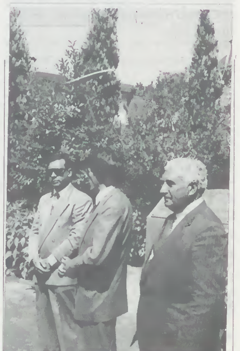
Presidente da R.T.V.M. ousando da palvара

Foram encerradas as comemorações com uma grande sessão de fogo de artifício, como corolário da alegria sentida por todos os Caldelenses que amam verdadeiramente a sua terra.