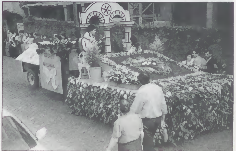
Cortejo Etnográfico das Festas concelhias de S.º António

FERREIROS , apresentou, um carro recoberto de verduras e flores, o cartaz das Festas: Santo António e os arcos decorativos tradicionais, ornamentação típica mantida ainda em muitas localidades do concelho de