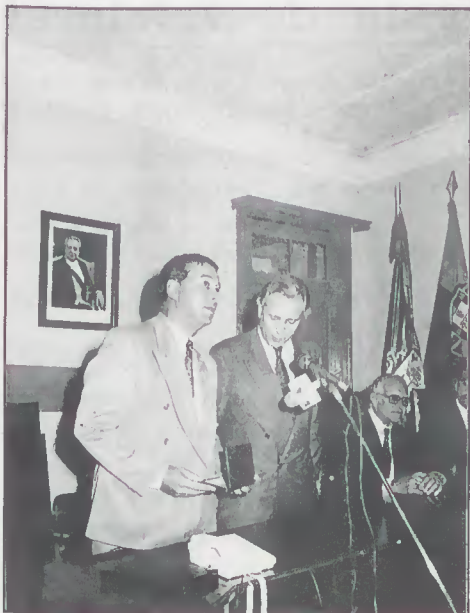
Recepção ao Senhor Secretário de Estado na Festa do Emigrante