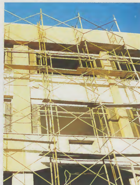
Novos Paços do Concelho