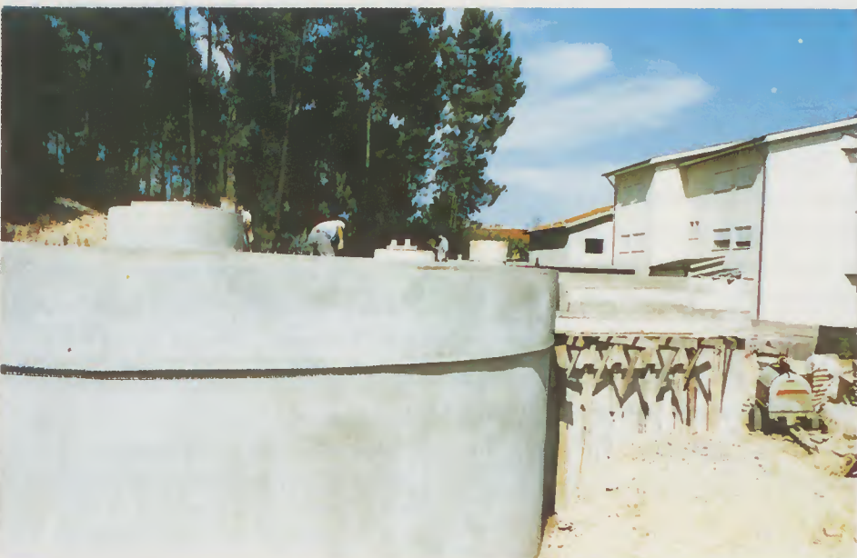
Reservatório de Ferreiros