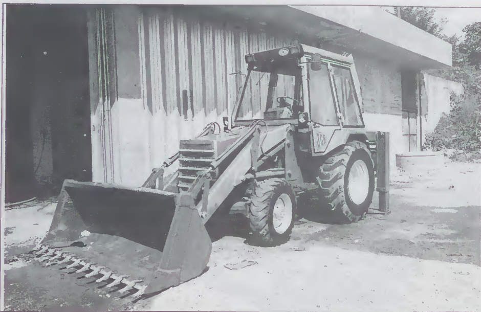
Aspecto da Retro-Escavadora, depois de reparada nas oficinas municipais