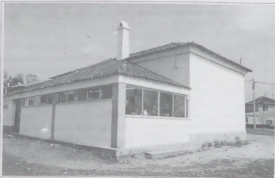
Construção de uma Sala de Aula em Prosêto