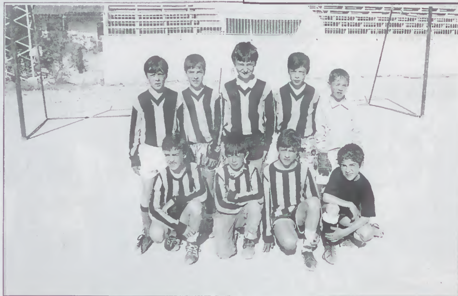
Equipa do Figueiredo vencedora do Torneio de Futebol

Esta acção envolveu cerca de 130 alunos que durante os meses de Fevereiro a Abril, participaram em encontros de futebol realizados no campo de jogos Eng. José Carlos Macedo do F.C.A., tendo constituído um êxito assinalável.