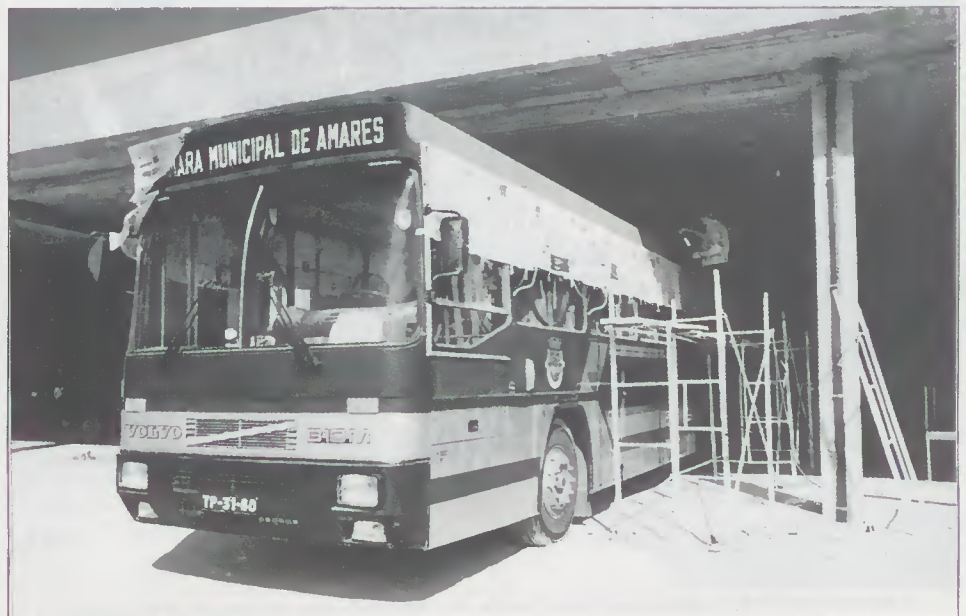
Reparação do autocarro nas oficinas Camarárias

- Construção de mobiliário e aplicação de soalhos e divisórias em madeira em edifícios públicos, no concelho.