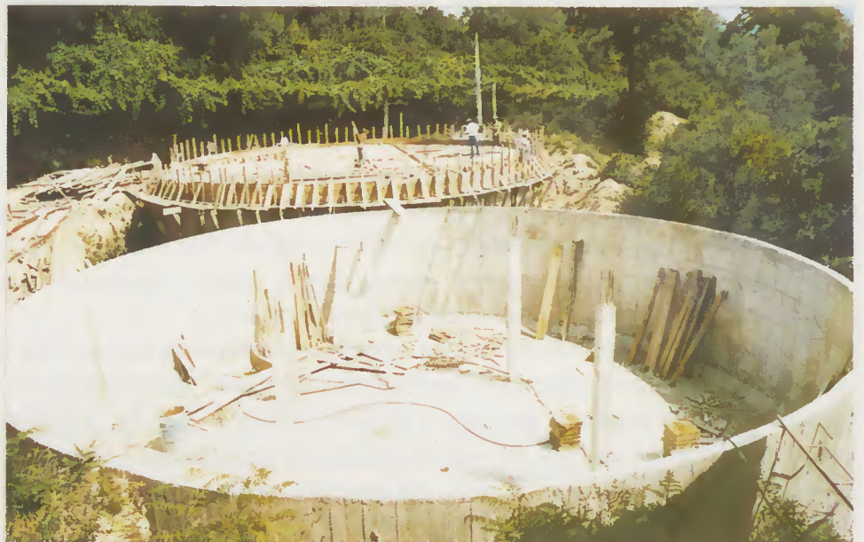
Reservatório de Besteiros