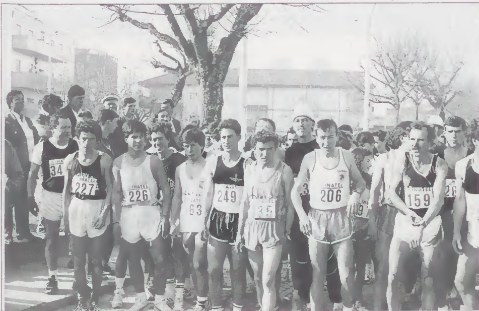
Partida do II Grande Prémio de Amares

De Caldelas, partiram para a escalada do Monte de S. Pedro, onde estes amantes do desporto ao ar livre deram asas à sua perícia, criatividade e imaginação, embrenhados de um espírito aventureiro, arrastando atrás de si uma multidão de simpatizantes por aquele desporto espectacular. Trata-se de uma modalidade desportiva a que a Câmara de Amares deu o seu apoio, criando, assim, oportunidade de divulgação do nosso concelho e das suas potencialidades turísticas.