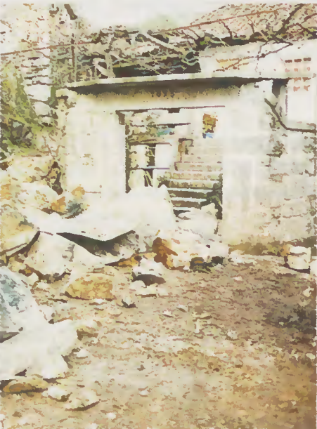
Alargamento do Caminho no Urjal - Seramil