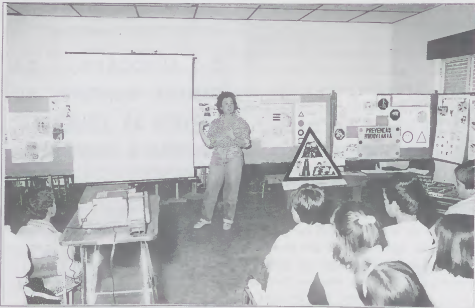
Acção da Prevenção Rodoviária Portuguesa nas Escolas