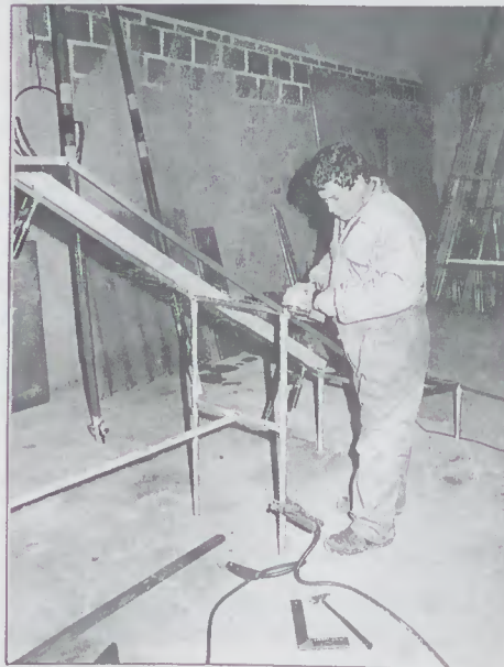
Oficina de Serralharia