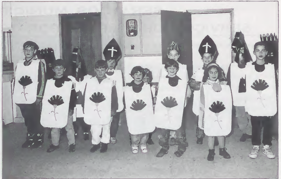
Acção de iniciação ao Xadrez

De realçar a excelente classificação das nossas escolas, num conjunto de 45 participantes do distrito, o que constituiu um excelente prémio para todos, professores e alunos, que ao longo do ano escolar deram o seu melhor em prol do desenvolvimento desportivo.