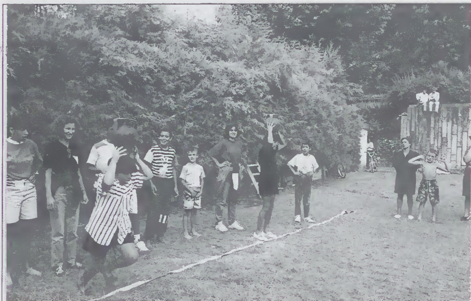
Jogos tradicionais na Animação Termal de Caldelas