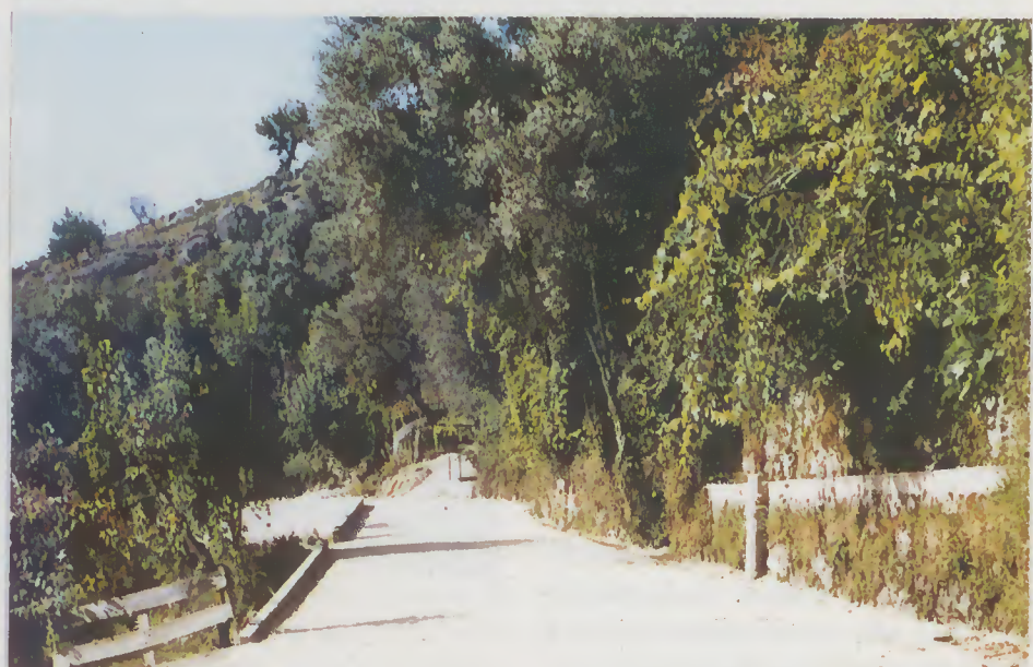
Caminho de Covas - Paranhos: Antes e Depois