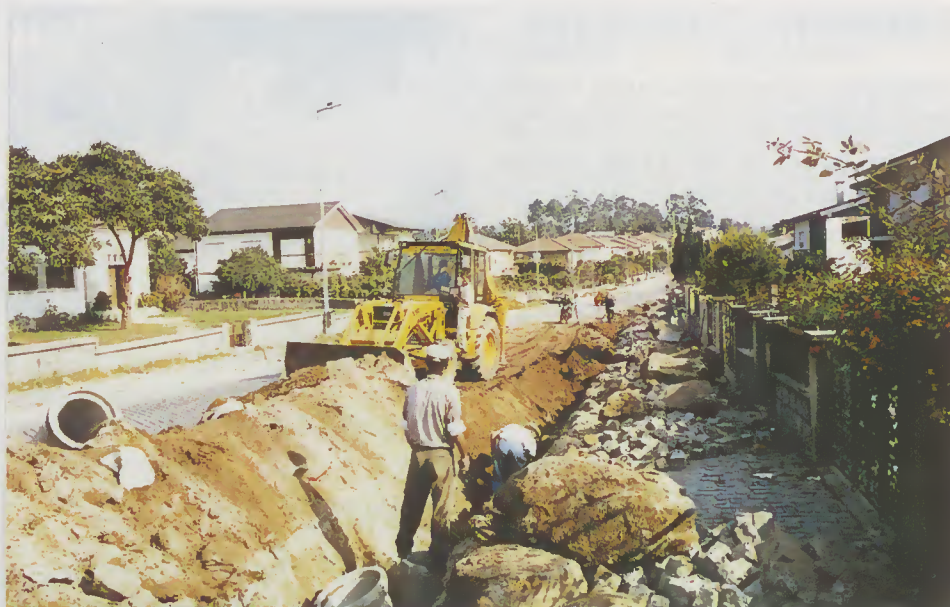
Pavimentação e drenagem da Rua Dr. Aristides Marques Vitela - Amareis