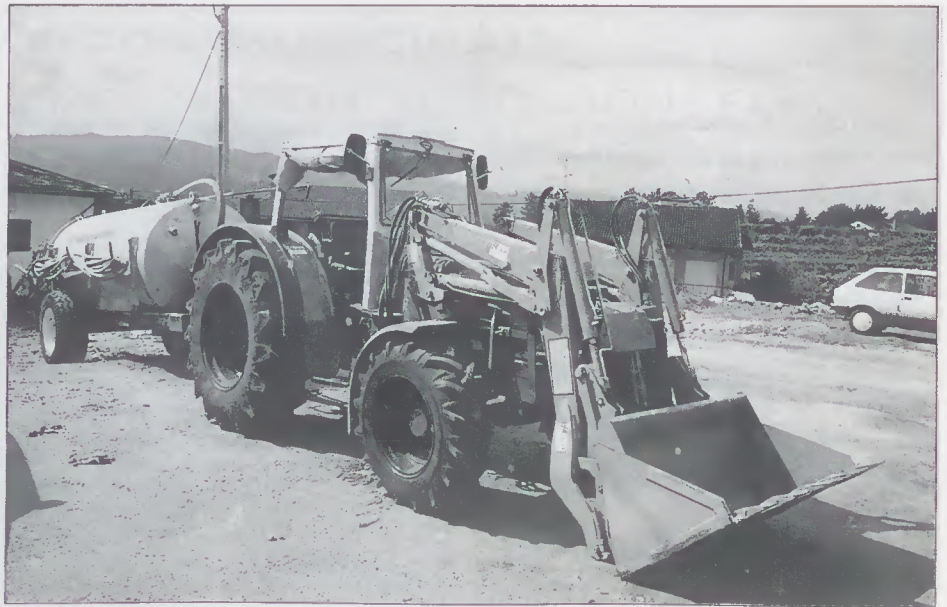
Novo tractor e cisterna para os serviços exteriores