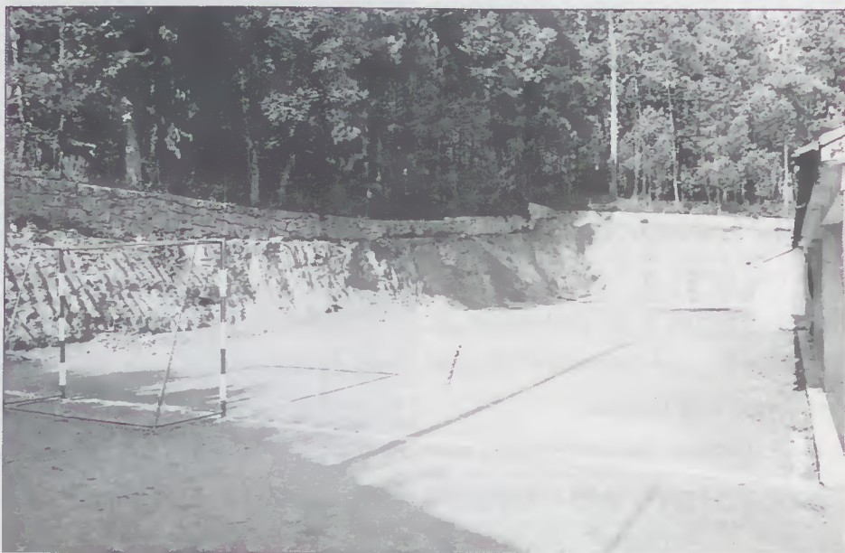
Arranjo do logradouro da Escola Primária de Caires

APROVEITAMENTO DOS RECREIOS para a prática de diferentes modalidades desportivas entre as quais o futebol e o basquetebol, colocando-se naqueles espaços balizas ou tabelas