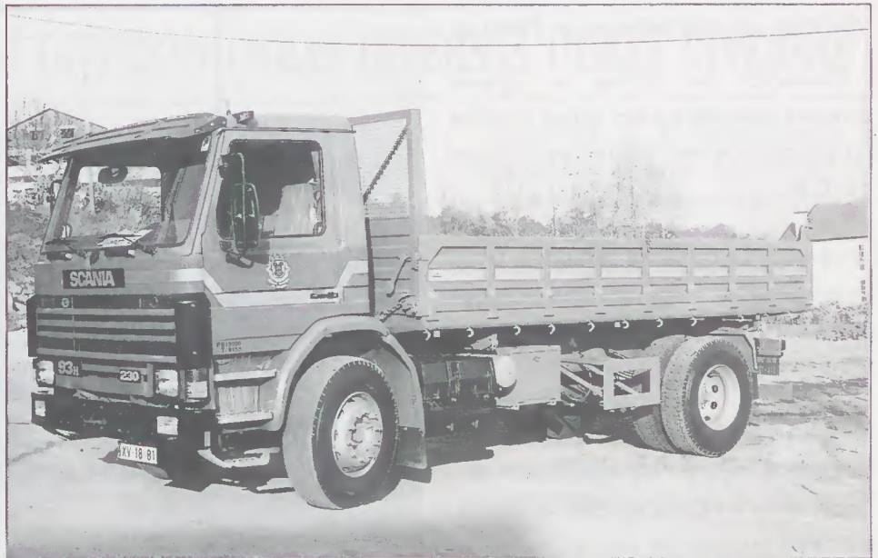
Novo Camião para os Serviços Exteriores

Manutenção de todas as viaturas através da lavagem e lubrificação das mesmas, trabalhos estes que realizados pelos nossos funcionários, se tornam muito menos dispendiosos para o Município.