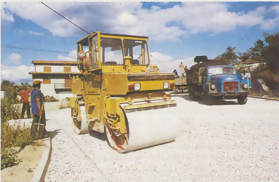
Pavimentação 2.ª Fase da Rua de Cintura