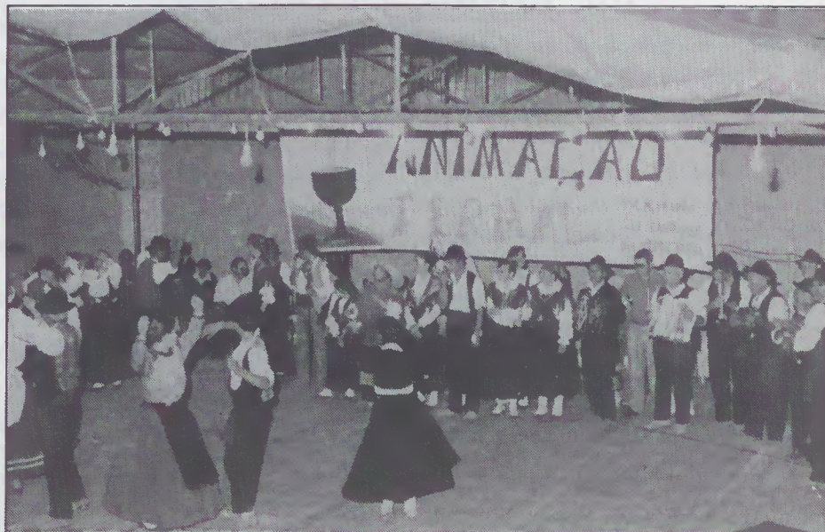
Animação Termal em Caldelas

A J.F. de Caldelas e a C.M. de Amares, Lago, levaram a efeito um programa de Animação Termal Verão/92, proporcionando, assim aos residentes, aos visitantes e a todos os termalistas, momentos de bem estar com base na alegria e na boa disposição que os agrupamentos folclóricos, bandas de música e outras formas de manifestação cultural são capazes de transmitir. As actuações decorreram à semelhança dos anos anteriores, num palco da Junta de Freguesia construído para o efeito, no Largo de Caldelas, um local aprazível e aconchegado que para o próximo ano estará já completamente arranjado beneficiando-se, deste modo, uma das mais belas e importantes estâncias termais do País a merecer, como se reconhece e tem sido defendido, a designação de Vila.