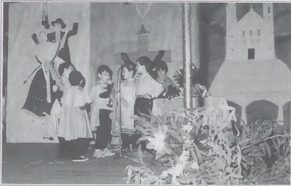
Aspecto da Festa da Escola de Rendufe