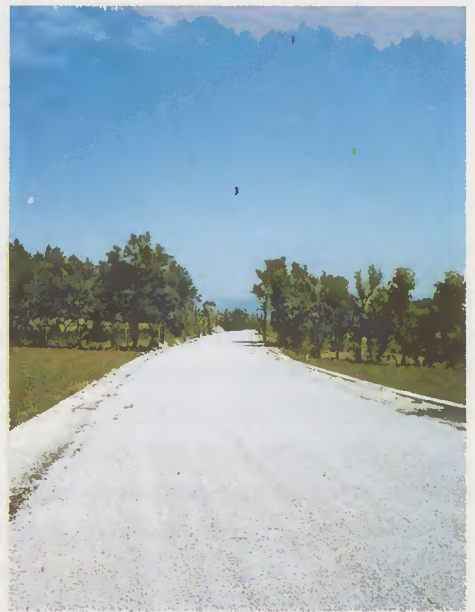
Pavimentação Paredes Secas - Vilela