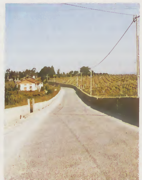
Pavimentação em Lago