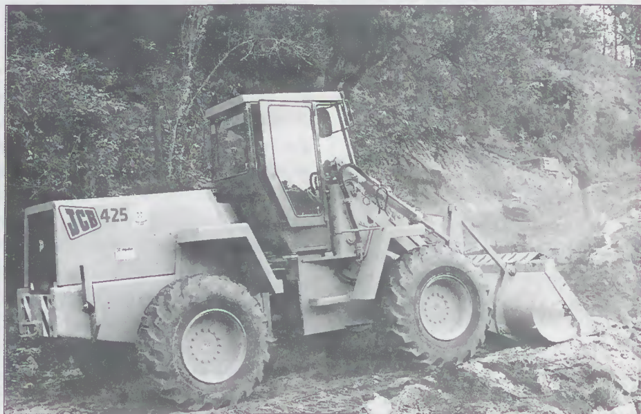
Aquisição de uma máquina de Pá-Carregadora