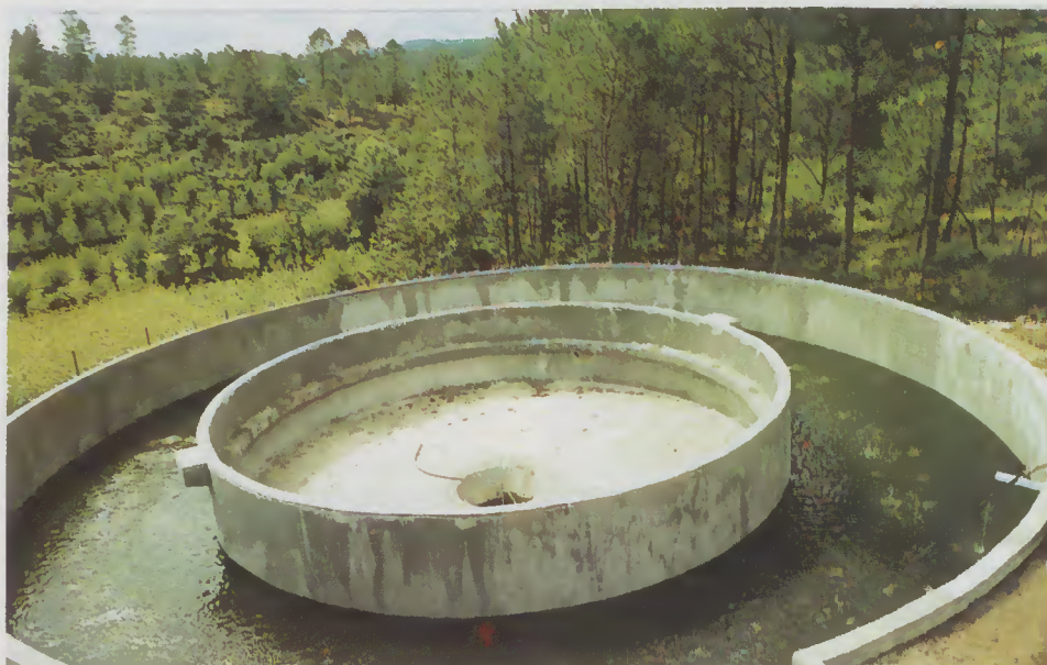
ETAR de Caldeias