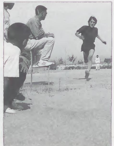
Aspectos da acção "Escola + Desportiva"