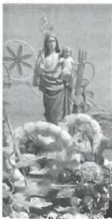
Santo António Nossa Senhora da Boa Viagem

A comunidade paroquial de S. Bartolomeu do Mar, à semelhança dos anos anteriores, vai celebrar com fé e piedade, no próximo dia 13 de junho, a festa em honra de Santo António e Nossa Senhora da Boa Viagem.