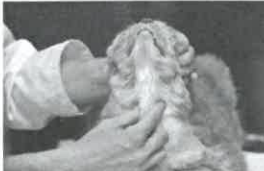
Palpação da tiroide.

Um dos sinais característicos desta doença é a perda de peso, hiperatividade, má condição geral do pêlo, aumento do apetite e aumento da ingestão de água. Os sintomas menos frequentes, mas também sinalizados são vómitos e diarreia. E 26 % dos gatos ficam letárgicos e apáticos. Na palpação da zona da traqueia muitas vezes conseguimos sentir glândula tiroide aumentada.