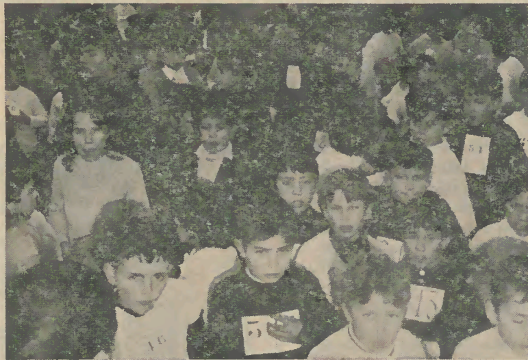
Centenas de crianças pedem um parque de jogos

A festa terminou e todos gostaram. Mas não podemos ficar só por aqui; Não basta que de longe as crianças corram pelos caminhos das suas aldeias. O Concelho de Vila Verde precisa de locais apropriados onde as crianças façam desporto a sério. A zona de Prado, que é a de mais densidade infantil do concelho de Vila Verde, precisa de um local apropriado para fins congêneres. Agora que o Fundo de Fomento Nacional de Desportos, em colaboração com o Ministério da Educação, está interessado em levar por diante estas iniciativas, achamos bem que as autarquias locais peçam um local para jogos onde haja o campo de desporto infantil e a piscina. Esta festa deu bem a entender que, nesta localidade, tudo é possível. Pois que vá por diante a ideia.