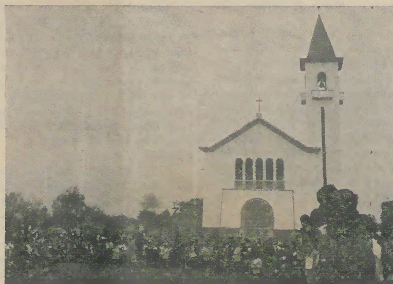
A pista de jogos foi a avenida da nova igreja de Prado