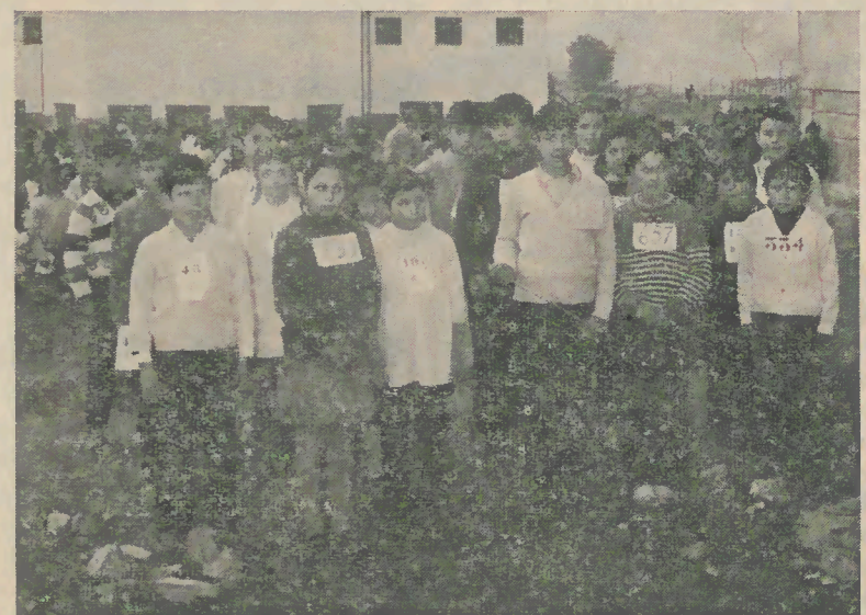
Os primeiros classificados alinham para o nosso fotógrafo

«Com este encontro quer levar-se por diante, e de forma progressiva, que a educação física seja uma realidade na vida