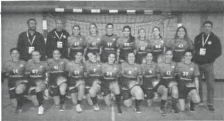
Equipa de Seniores de Andebol da Juve Mar

O nervosismo foi grande e muito, e, apesar de ter feito um bom jogo, a equipa de andebol feminino da Juventude de Mar, em Esposende, não resistiu ao poderio do primo divisionário Alavarium, de Aveiro, perdendo nos quartos de final, na Taça de