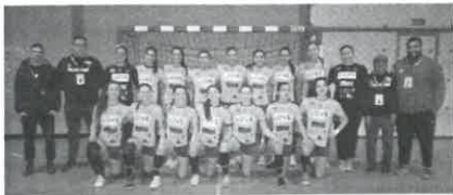
Equipa de Andebol do Alavarium

A alegria e a confiança das atletas de Esposende foram uma constante, pelo que valorizaram o encontro.