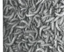
Figura 2: Larvas de Tenebrio molitor

Segundo o Manual de Boas Práticas na Produção, Processamento e Utilização de Insetos na Alimentação Animal, revisto e publicado pela DGAV (Direção Geral de Alimentação e Veterinária), em março de 2021, desde 2017 que o uso de insetos na ração para peixes de aquicultura, nos animais de companhia e nos animais de Zoo está autorizada na Europa, inclusive em Portugal. No que diz respeito às rações para cão e gato, já podemos encontrar disponível no mercado várias marcas que utilizam este "novo" ingrediente na sua formulação, nomeadamente as rações hipoalérgicas, com várias indicações médicas para a sua utilização.