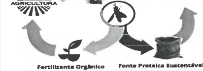
Figura 1: Utilização dos insetos no ciclo de produção.

Será o uso de insetos na alimentação de algumas espécies de produção uma solução para a escassez de recursos? Segundo a FAO (Organização das Nações Unidas para Alimentação e Agricultura) estima-se que em 2050 a população mundial será de 9.5 bilhões de pessoas em todo o mundo, ou seja, a pressão sobre os nossos recursos não tem previsão de abrandar.