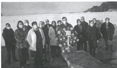
Romagem ao cemitério de Mar em homenagem aos nascidos em 1956 e já falecidos