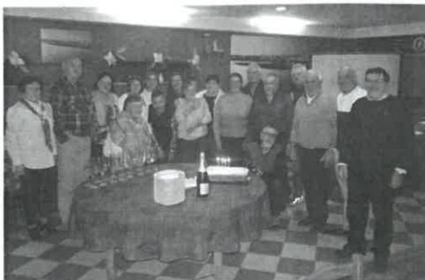
O grupo dos nascidos/residentes em Mar, em 1956