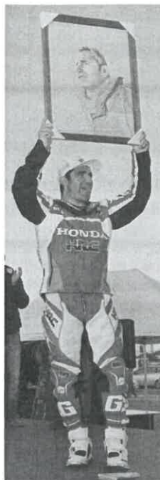
O super campeão Paulo Gonçalves dá nome ao maior prémio desportivo, em Esposende.

No dia 4 de dezembro decorreu, no Pavilhão Desportivo de Fão, em Fão, a Gala de Distinção de Mérito Desportivo, promovida pela Câmara Municipal de Esposende.