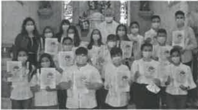
Grupo do 7º Ano e suas Animadoras.