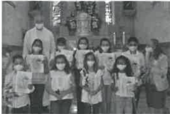
Grupo do 6º Ano e uma sua Catequista.

Estão de parabéns as crianças e os adolescentes pelo modo como se prepararam para esta celebração e pelo modo consciente e muito responsável como desempenharam as diversas tarefas que lhes foram confiadas. Estão de parabéns também e merecem o muito obrigado da parte da comunidade paroquial as suas catequistas e animadoras, pelo trabalho realizado ao longo do ano de catequese e pelo trabalho desenvolvido na preparação e realização da Festa da Fé.