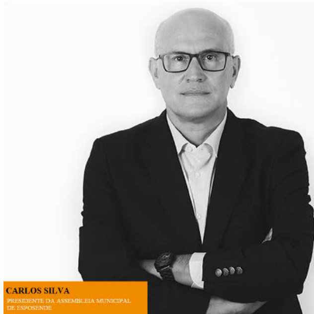
CARLOS SILVA PRESIDENTE DA ASSEMBLEIA MUNICIPAL DE ESPOSENDE