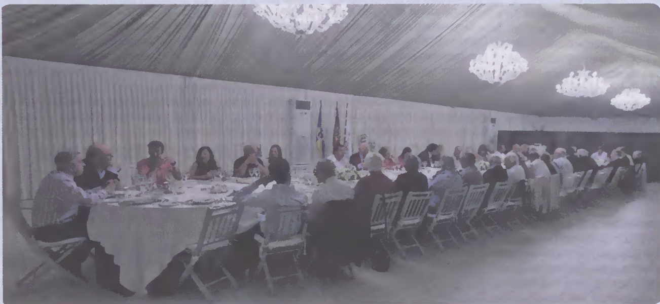
Jantar de Convívio