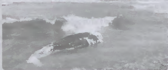
Na manhã do dia 24 de abril passado, deu à costa no concelho de Esposende, em zona no domínio do Parque Litoral

Norte, o corpo de um cetáceo, ao que tudo indica uma baleia anã. O alerta foi dado por um popular que realizava exercícios de manutenção física na zona dunar da freguesia de Mar, São Bartolomeu, quando avistou, na zona de rebentação das ondas, a baleia. De imediato foi dado o alerta para os Bombeiros Voluntários de Esposende, que, por sua vez, passaram o caso à Proteção Civil de Esposende, que, juntamente com a Polícia Marítima, estiveram no local.